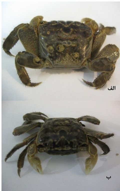
شکل ۲. Chiromantes boulegeri (Calman, 1920). جنس نر، رودخانه ارونرد رود. الف، سطح پشتی، ب، سطح جلویی.

طبقه‌بندی (جدول ۱) گونه C. boulegeri (Calman, 1920) (شکل ۲) مطابق طبقه‌بندی NCBI از خانواده Sesarmidae Dana, 1851 جنس Chiromantes Gistel, 1848 می‌باشد.