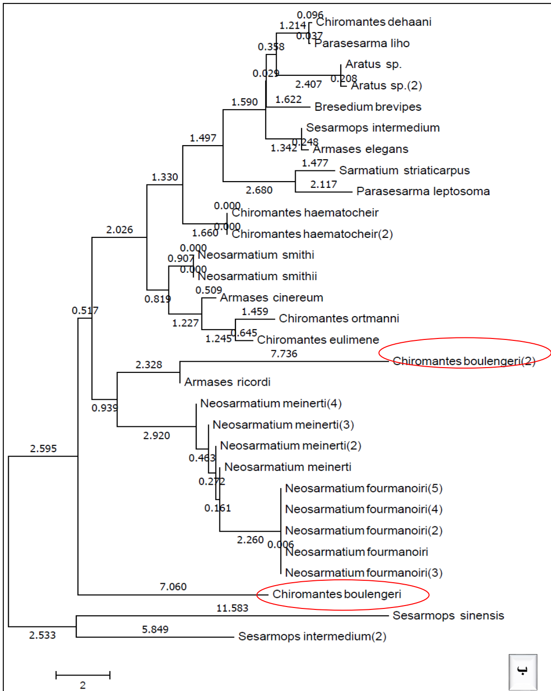
شکل ۳. روابط فایلوژنی گونه های انتخاب شده از جنس Chiromantes و دیگر Sesarmidae ها. الف، بر اساس Maximum composite Likelihood با ۵۰۰۰ تکرار، ب، بر اساس Neighbor- Joining.

(ایران) داشتند (شماره های دسترسی: FN296219- FN296220). آنالیزهای مولکولی، طبق درخت فیلوژنی (شکل ۷) نشان دهنده ارتباط نزدیک بین جنس Chiromantes با جنس Neosarmatium می باشد.