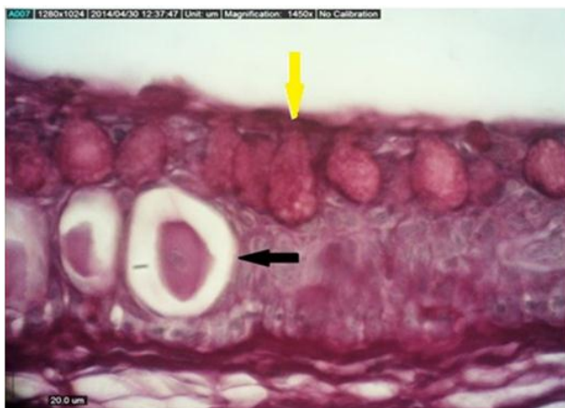
شکل ۲: اپیدرم ناحیه خط جانبی، گروه تیمار (۱۲ppt). تعداد سلول‌های گریزی شکل خط جانبی پوست ماهی بنی در