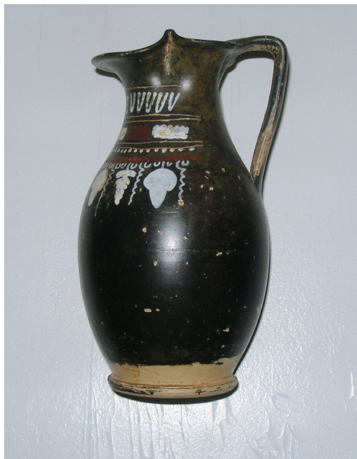
Slika 7: Enohoja Aleksandrijske grupe iz Arheološke zbirke Issa, fotografija: M. Miše.