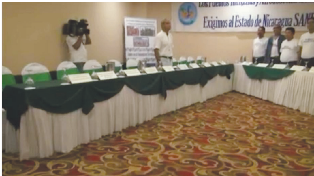
Figura 3 LAS SILLAS VACÍAS EN EL HOTEL CROWNE PLAZA