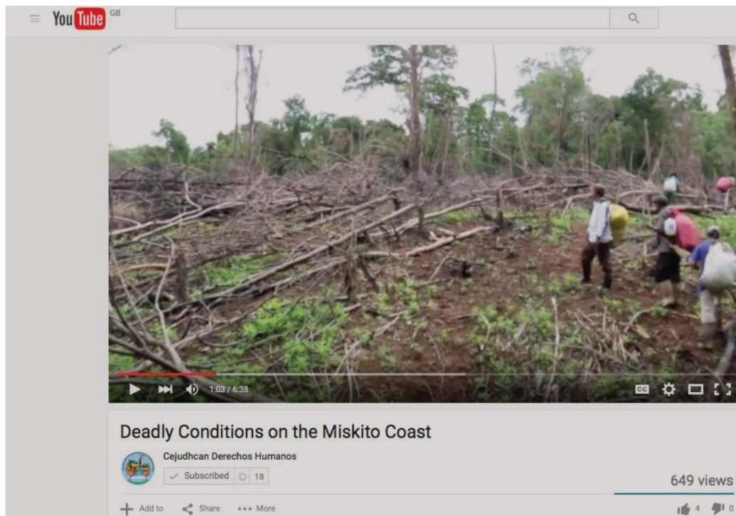
Figura 4 DESTRUCCIÓN AMBIENTAL EN WASPAM

Fuente: CEJUDHCAN, derechos humanos (2015c).