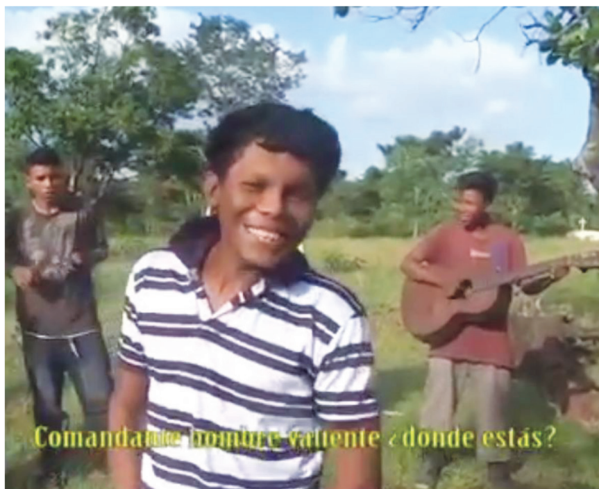
Figura 5 LOS JÓVENES DE FRANCIA SIRPI