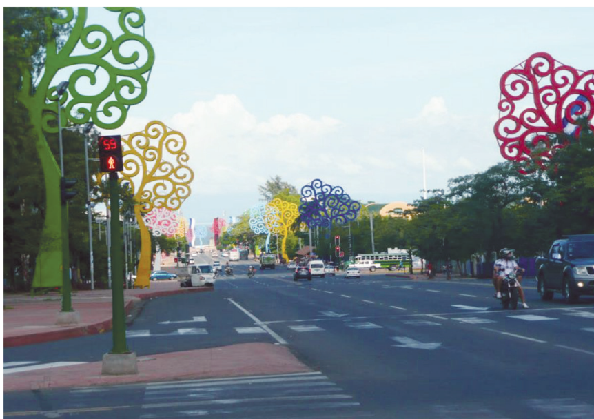
Figura 2 ÁRBOLES DE LA VIDA EN MANAGUA