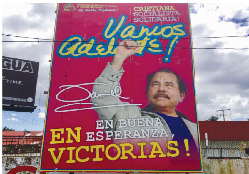
Figura 1 VALLA PUBLICITARIA DE DANIEL ORTEGA

que recorren las calles de Managua (Figura 2). 2 Sin embargo, existen pruebas de que el consentimiento para la versión orteguista de la realidad es cada vez más difícil de asegurar.