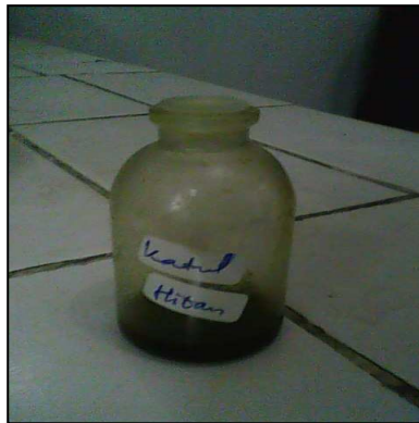
Minyak Bekatul Kasar Hitam