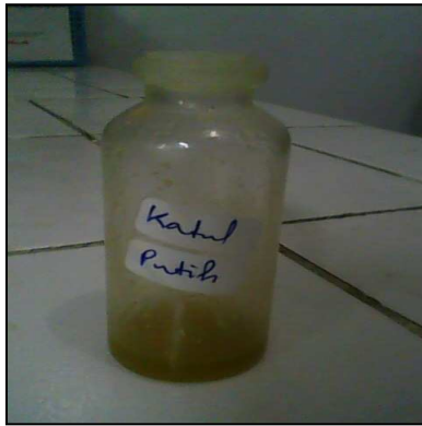
Minyak Bekatul Kasar Putih