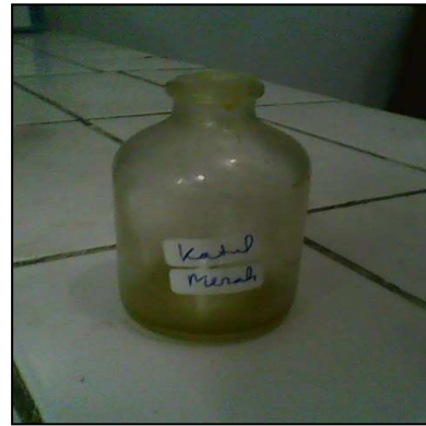
Minyak Bekatul Kasar Merah