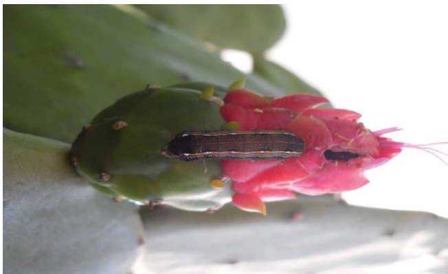
Figura 9. Lagarta se alimentando de palma forrageira.