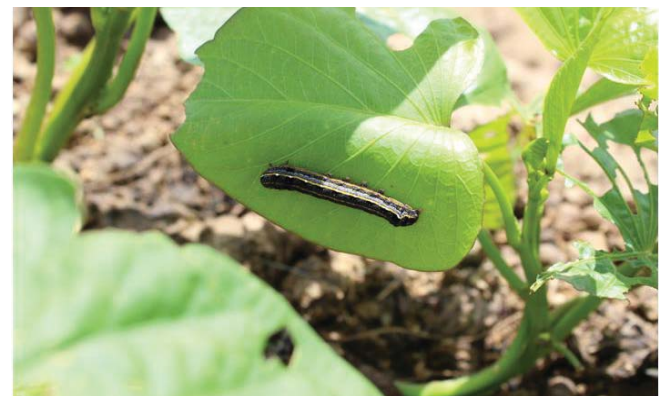
Figura 5. Lagarta atacando amendoim.