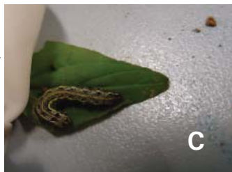
Figura 4. Adulto (macho) (A), ovos (B), lagarta (C) de Spodoptera eridania .