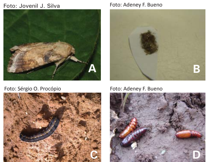
Figura 3. Adulto (macho) (A), ovos (B), lagarta de último instar de Spodoptera cosmioides (C) e pupas de Spodoptera sp. (D).

Os adultos da lagarta são mariposas de hábito noturno, com 40 mm de envergadura, asas posteriores brancas e anteriores pardas (mais amareladas nos machos), com desenhos em mosaico (Figura 3A). As fêmeas põem os ovos agrupados em massas (Figura 3B), nas folhas baixas das plantas. Dos ovos nascem as lagartas (Figura 3C), que passam geralmente por seis instares (fases do desenvolvimento), podendo este número variar entre quatro e oito, dependendo da planta hospedeira (BAVARESCO et al., 2002, 2003, 2004; ZENKER et al., 2007). As lagartas constituem a fase que causa os danos às culturas, e apresentam variação no padrão de manchas e na coloração, podendo ser cinza-claras, castanhas, ou