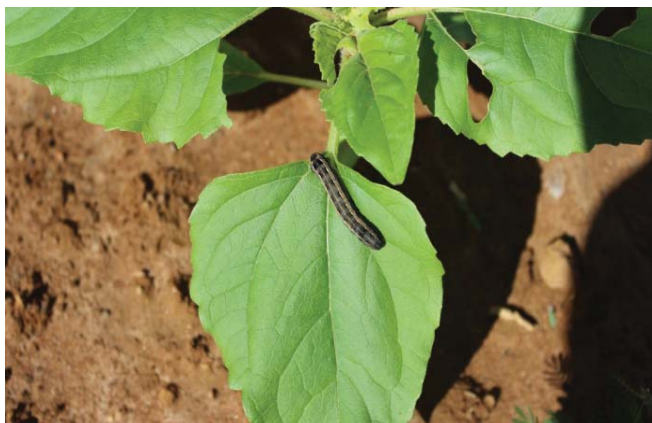
Figura 7. Lagarta atacando girassol.