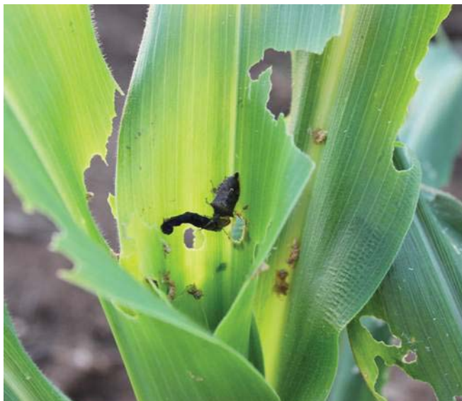
Figura 12. Percevejo Podisus nigrispinus predando lagarta de Spodoptera sp.