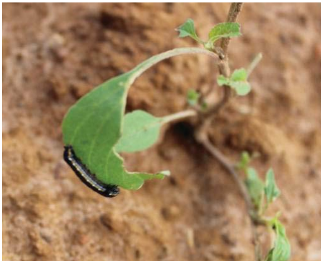
Figura 11. Lagarta atacando o caruru ou bredó.