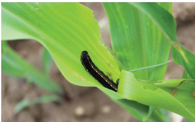
Figura 8. Lagarta atacando milho.