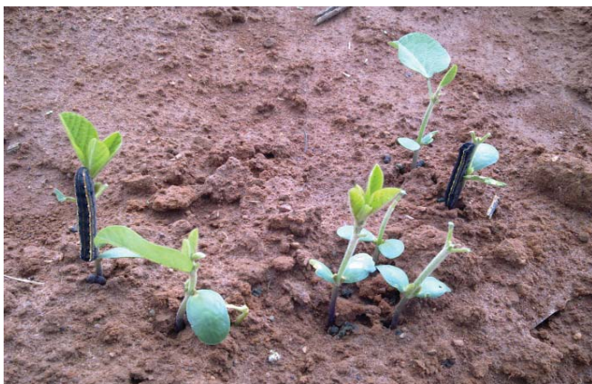
Figura 10. Lagartas atacando soja.

A espécie ou a variedade da planta hospedeira pode influenciar o desenvolvimento das pragas. Por exemplo, lagartas de S. cosmioides criadas em soja e algodão se transformam em adultos mais rapidamente (33-35 dias) que aquelas que se alimentam de milho (42 dias) em laboratório (aproximadamente 25°C de temperatura, 70% de umidade relativa e 14 horas de luminosidade). A sobrevivência das lagartas também é maior em soja e algodão (76,7 e 78,3%, respectivamente), em comparação com milho (1,7%). Tais resultados indicam melhor adequação da soja e do algodão como hospedeiros de S. cosmioides , quando comparados ao milho (SILVA et al., 2011). No entanto, um grande ataque dessas lagartas foi observado até mesmo em cultivos de milho transgênico Bt nas regiões de Carira – SE e Paripiranga – BA, na safra 2013. Embora possa se alimentar do milho quando está no 5º ou 6º ínstar, o inseto não consegue completar a fase jovem somente com essa dieta. A praga pode se alimentar de outras plantas hospedeiras que se encontram nas lavouras; e quando essas plantas entram em senescência (natural ou aplicação de herbicidas) é provável que as lagartas de 5º ou 6º ínstar migrem para as plantas de milho na busca de alimento e assim algum dano pode ser ocasionado. Boiça Junior et al. (2013) também verificaram diferenças em parâmetros biológicos de S. cosmioides , quando as lagartas foram alimentadas com diferentes variedades de amendoim, de hábitos de crescimento ereto e rasteiro.