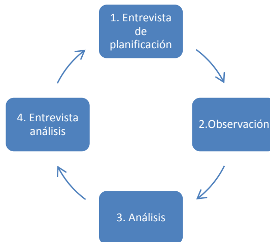
Figura 1. Gráfico del ciclo de mejora

En la fase 1, entrevista de planificación, cada mentor se entrevista con los noveles a su cargo y los informa del plan de asesoramiento: objetivos, acciones, observaciones, análisis, bibliografía aconsejable y temporalización. En la fase 2, observación, el profesor mentor observa la clase impartida por el novel, siendo opcional la grabación en video para su posterior análisis. En la fase 3, análisis, se emplean instrumentos de análisis proporcionados a los profesores mentores, que van dirigidos a analizar las siguientes cinco dimensiones de la práctica en el aula: