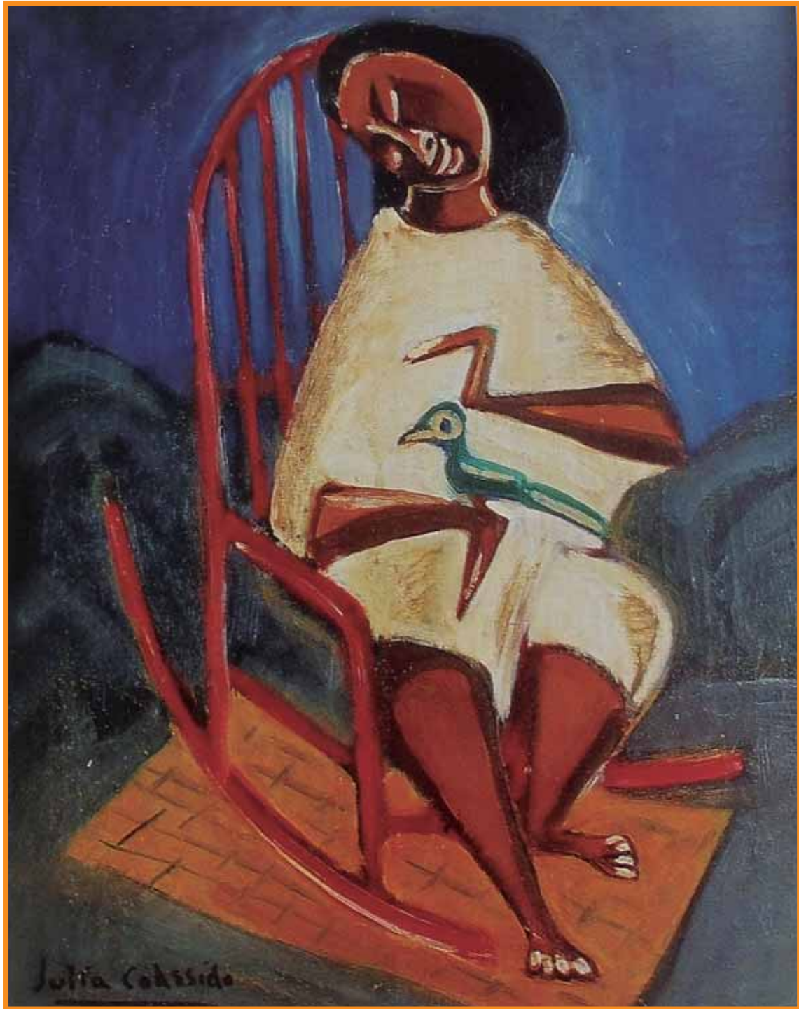
Ave azul . Colección particular.