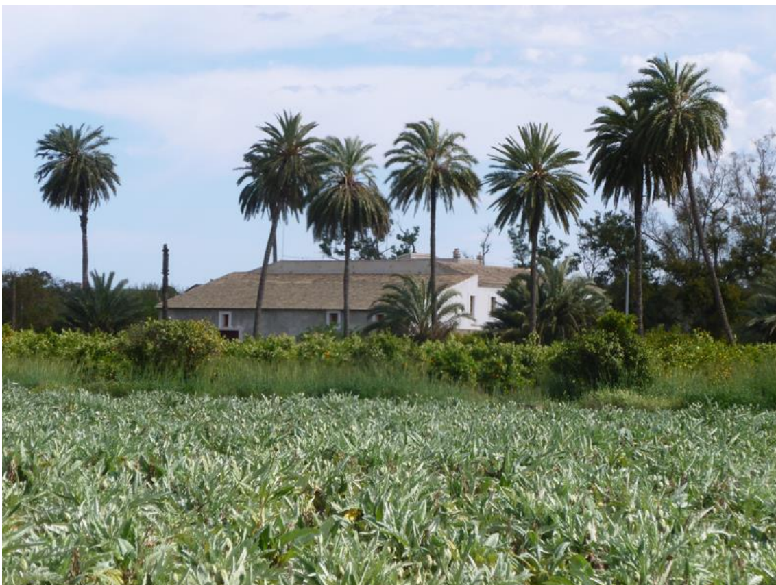
Link 04. Conjunto de palmeras en el interior de la finca Rioflorido de Almoradí.