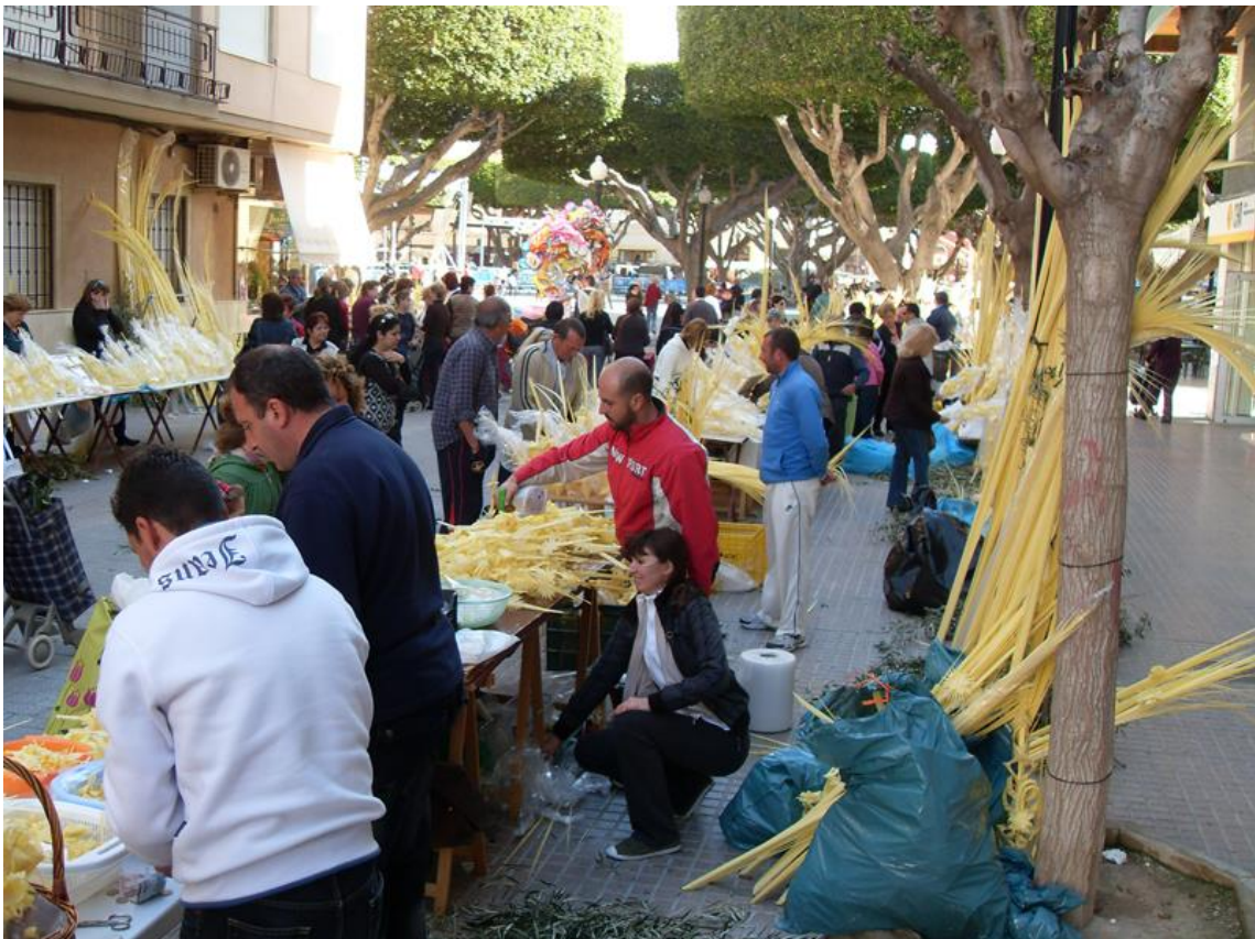
Link 07. Venta de palma blanca para la festividad de Domingo de Ramos en el mercado de Almoradí. Uno de los principales aprovechamiento del palmeral en la actualidad.