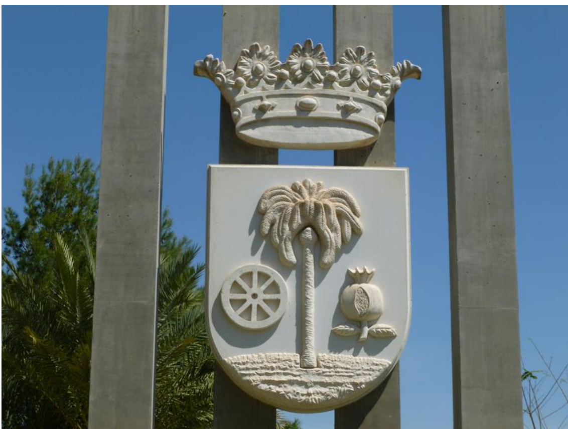
Link 05. Escudo del municipio de San Isidro, donde la palmera se incorpora como símbolo identitario de la población.