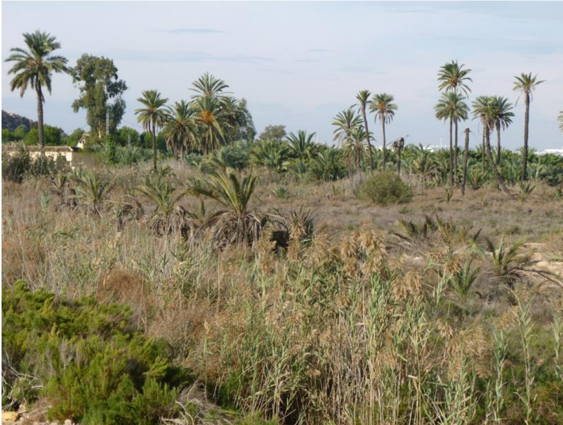
Link 09. Vista del palmeral espontáneo en parcelas de suelos salinos en el entorno de la población de San Isidro.