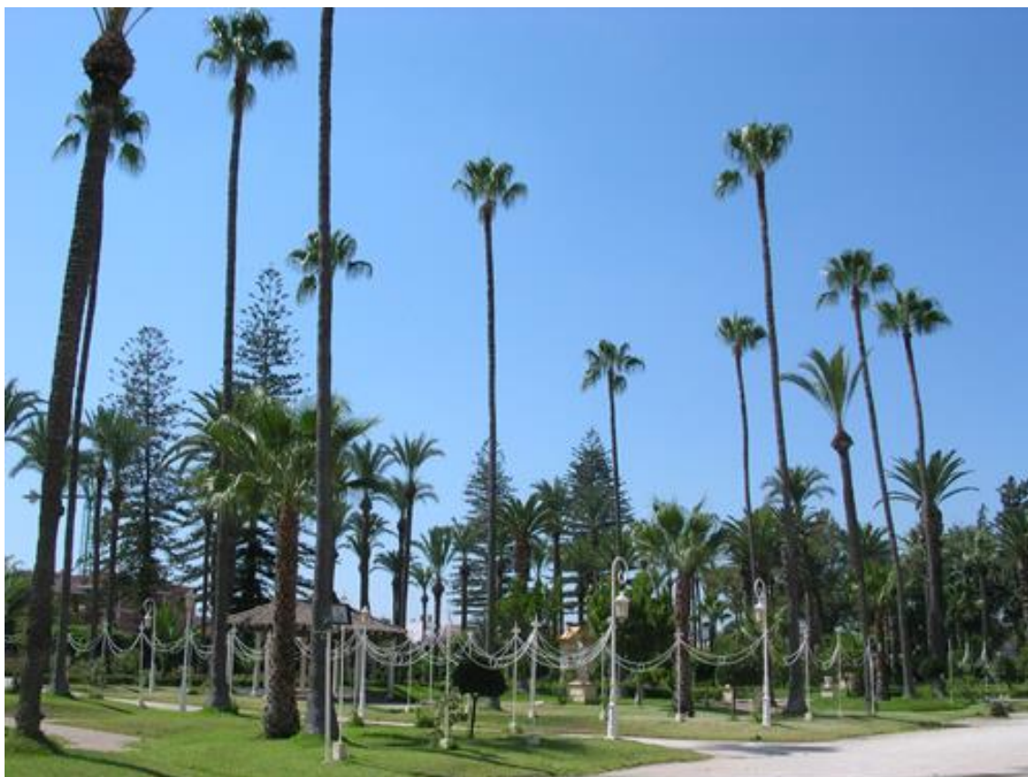
Ilustración 08. Conjunto ajardinado en las inmediaciones del palacio de Jacarilla, antiguo predio de origen señorial.

Igualmente la palmera Washingtonia se ha convertido en un elemento indiscutible del frente litoral y de los conjuntos urbanos residenciales surgidos al amparo del turismo. En efecto, a la hora de llevar a cabo el ajardinamiento de paseos litorales, embellecer tanto playas como el callejero de las urbanizaciones y las fincas privadas, esta variedad domina sobre las tradicionales. Con la plantación masiva de esta especie, se ha querido proyectar una imagen estereotipada tratando de magnificar la calidad turística, hacia un “tropicalismo” de estética caribeña, en contraposición a la visión romántica “orientalista” que caracterizó el interior huertano.