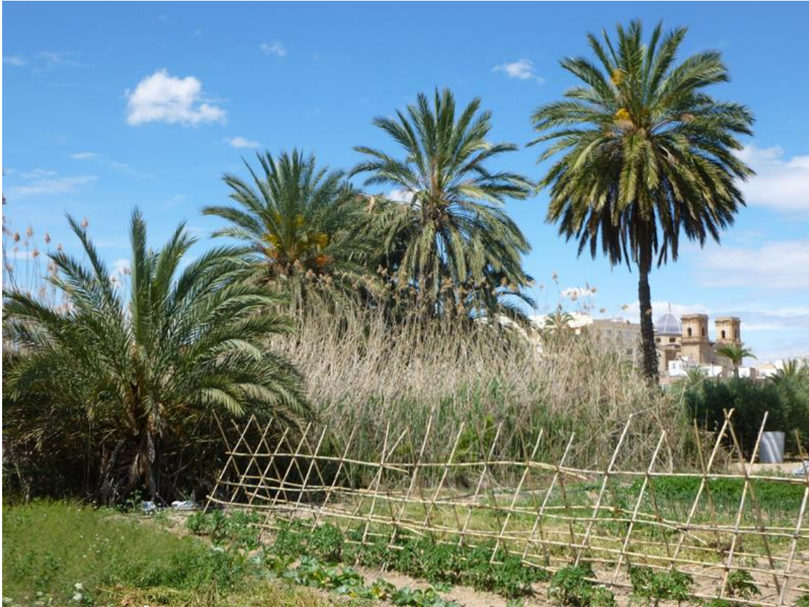
Link 01. Cultivos asociados en las inmediaciones de Albatera.

como sucede en ocasiones, el desconocimiento generalizado por la población, unido a la pérdida de rentabilidad agraria y la falta de celo de la propia administración local y autonómica en el cumplimiento legal, ha desembocado en la dejadez que se tiene de la imagen de la Huerta, donde la palmera es un elemento representativo y palpable. Fruto de esta indiferencia y la primacía de otros intereses económicos en contra de los agrarios, se ha agravado todavía más el deterioro paisajístico donde los troncos descabezados de las palmeras afectadas por el picudo permanecen como testigos mudos.