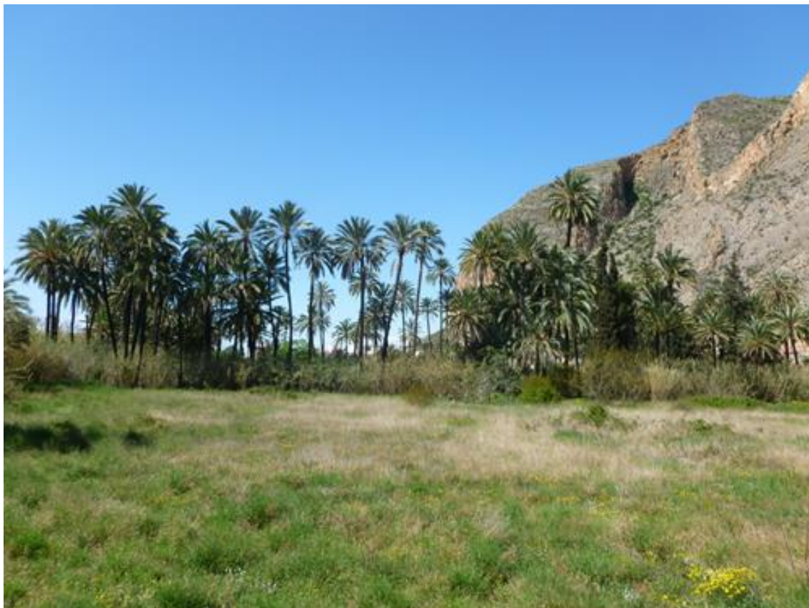
Ilustración 01. Palmeral de Callosa de Segura, conjunto que se ha visto reducido por el incremento de las roturaciones agrarias.

En los últimos años la situación se ha agravado, no sólo por la plaga, sino también por el trasplante intensivo para fines ornamentales urbanos, sobre todo en la franja costera. La proliferación de áreas turístico-residenciales; la creación de nuevos espacios comerciales e industriales; junto con las vías de acceso y los ensanches de las poblaciones, han demandado grandes cantidades de palmeras. Esta solicitud ha procedido en gran medida de viveros, pero también del arranque de ejemplares en las parcelas de huerta, sin olvidar la importación. Fue precisamente esta última actividad comercial la que facilitó la introducción del picudo rojo. Este conjunto de amenazas está causando un proceso regresivo, poniendo en peligro la pervivencia no sólo de un sistema de producción ya residual, sino también de un armonioso paisaje o ambiente propio de la huerta mediterránea que contrasta con la uniformidad visual que genera, en el minifundio, el monocultivo citrícola interrumpido únicamente por superficies abandonadas o en blanco dedicadas todavía a los pocos rendimientos herbáceos que se dan.