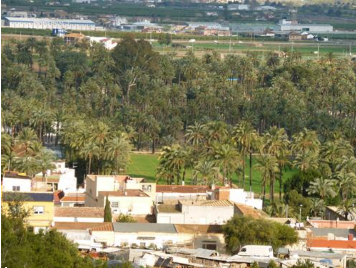
Ilustración 04. Vista del palmeral de Orihuela, protegido como Paraje Pintoresco desde 1963.