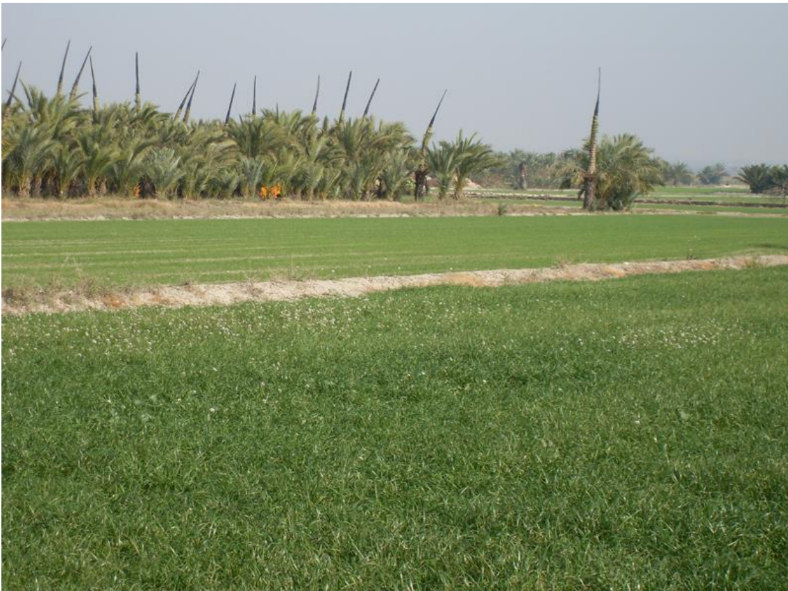
Link 08. Vivero de palmeras en Catral, ante la demanda de las mismas para la ornamentación del litoral. Algunas aparecen encapuruchadas para la obtención de palma blanca.

Uno de los problemas de la desaparición del palmeral en la Huerta es la falta de renovación de los ejemplares ante la inexistencia generalizada de una normativa de protección y fomento de la palmera en los municipios, con la única excepción de Orihuela, en donde ha sido de dudosa aplicación. El articulado contemplaba por la supresión, trasplante o encapuchado, además de una sanción económica que oscilaba de 50.000 a 250.000 ptas, la reposición de un número de unidades de entre 5 y 10 por cada palmera. En este último caso, la mitad se plantarían en la misma finca y las restantes en aquella parte del término que indicara el Ayuntamiento. De haber sido escrupulosos en su cumplimiento y de haberse contado con una legislación similar en otros consistorios, muy diferente sería la visión que hoy ofrecería el paisaje huertano. A esta lamentable situación hay que unir los efectos devastadores de una plaga que se ha propagado en la comarca a consecuencia de la importación de ejemplares que, procedentes de otros ecosistemas, han venido a ornamentar ámbitos urbanos de carácter residencial vinculados con el turismo. Se pone de manifiesto también en esta actuación la falta de un control sanitario ante la entrada de los ejemplares y la carencia de medidas una vez asentado el picudo rojo.