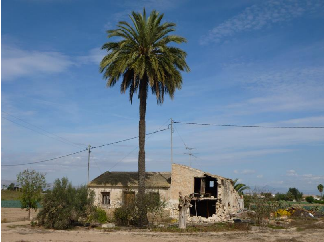
Link 02. La crisis de la agricultura familiar y la despoblación de la huerta han originado un marcado deterioro paisajístico donde la palmera permanece como testigo del paso del tiempo.