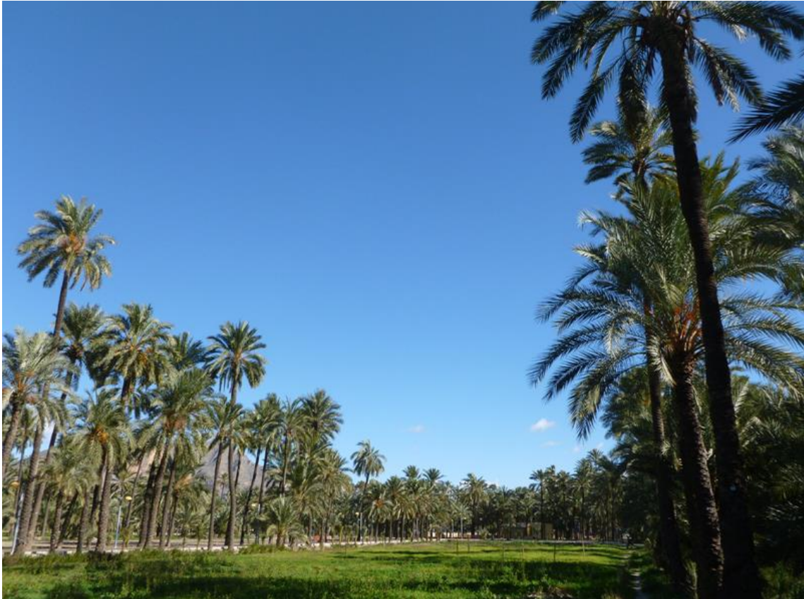
Link 06. Detalle de una parcela cultivada en el Palmeral de San Antón de Orihuela.