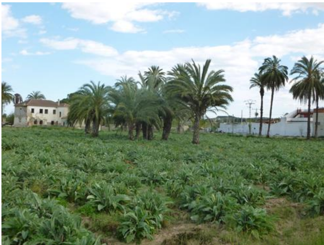
Ilustración 07. La palmera dominante en el paisaje huertano emerge en el interior de las parcelas cultivadas.

En algunas plazas de las poblaciones huertanas destacan individuos de gran porte que ornamentan el espacio cívico social de convivencia por excelencia, como se observa en las plazas Cardenal Belluga de Dolores, central de San Fulgencio o en la Plaza del León de Daya Vieja. En esta última, la presencia de seis ejemplares agrupados de más de 150 años ha servido de justificación, a fin de evitar su rotura en caso de fuertes vientos, para la construcción de un corsé metálico a base de chapas y tubos de acero inoxidable que se eleva hasta una altura de diez metros, con el pretexto de generar un mirador por encima del caserío para contemplar la huerta. Llama la atención que la creación de esta obra con un coste de 552.489 euros ( Información , 9-I-2011) se haga para visualizar un espacio agrícola circundante bastante degradado y fragmentado por la urbanización. La administración autonómica, en los últimos años, también ha intervenido con la plantación de palmeras formando jardines en las rotondas de los nuevos viales que circunvalan los núcleos urbanos.