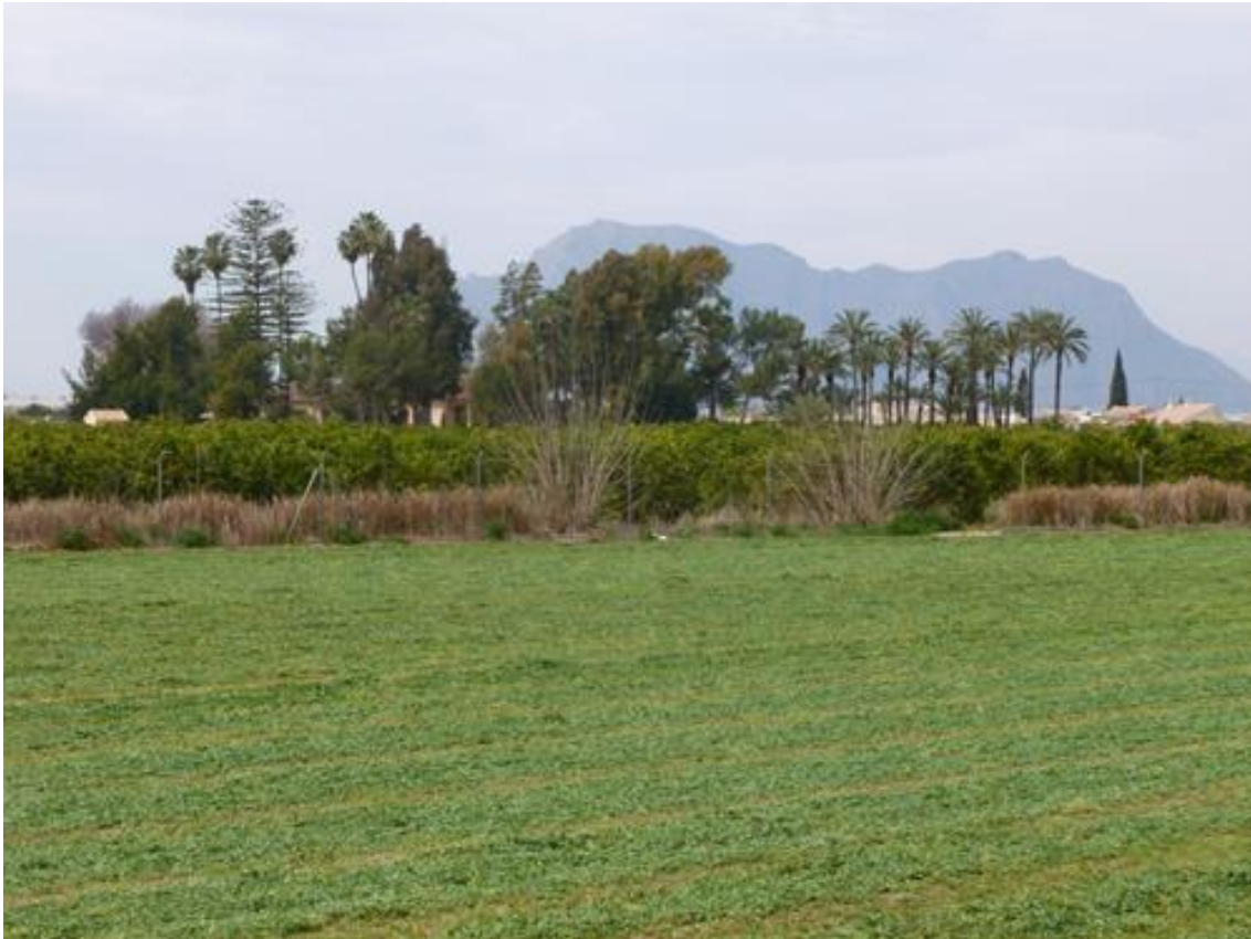
Ilustración 02. Vista de la finca Consolación en Almoradí, cuyo acceso se encuentra bordeado de palmeras.

considerar que constituye uno de los rendimientos más valorados y símbolo dominante en el paisaje (Sermet, 1956). Como corolario de este colectivo conviene citar el estudio lingüístico titulado El Habla de Orihuela , realizado por José Guillén a finales de los años sesenta. En una época en la que todavía las señas de identidad de la Huerta estaban vivas ya se vislumbraba, sin embargo, un proceso de mutación que amenazaba su desaparición, y la obra queda como “ un testimonio para el futuro ”. Dedicada de este modo expresamente un capítulo a la “ palmera ”, de la que reseña: “ se identifica plenamente con el paisaje oriolano. Surgen aisladas, junto a las barracas y casas huertanas, se alinean festoneando veredas y avenidas, o circundan y hasta invaden los bancales, agrupándose en una gran masa vegetal ” (Guillén, 1974).