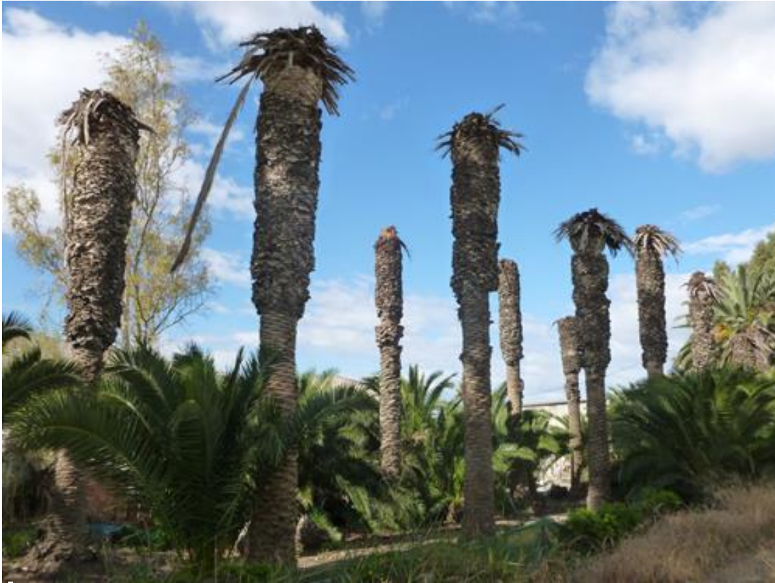
Ilustración 06. Ringleras de palmeras afectadas por el Picudo Rojo en el acceso a la finca Casa Llopis.

En la actualidad, la palmera subsiste de forma dispersa y tan sólo permanece como testigo residual de lo que antaño fue una huerta salpicada de palmeras. De forma paralela, también han desaparecido las utilidades que de ellas aprovechaba el agricultor: así es frecuente comprobar en el derruido hábitat rural que dio vida a este espacio el uso que de sus troncos se hizo como vigas en la construcción; el de los tallos de las palmas para formar las bardizas trenzadas que cercaban las parcelas, alternando con la caña común, tan vinculada a los canales de riego y avenamiento; y la hoja de la palma, necesaria en la fabricación de escobas, que asociado de nuevo al cañizo, dio origen en Albaterra y Catral a una peculiar industria local que ha incorporado más recientemente al proceso de fabricación otras fibras naturales de importación.