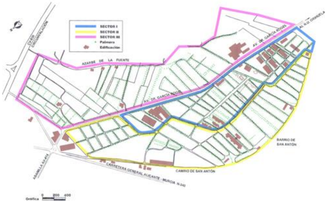
Ilustración 05. Sectores en los que se divide la superficie protegida del Palmeral de San Antón de Orihuela.

corporación local en el cuidado y mantenimiento de este paraje en las puertas de la ciudad ( Información , 17-VI-1997).