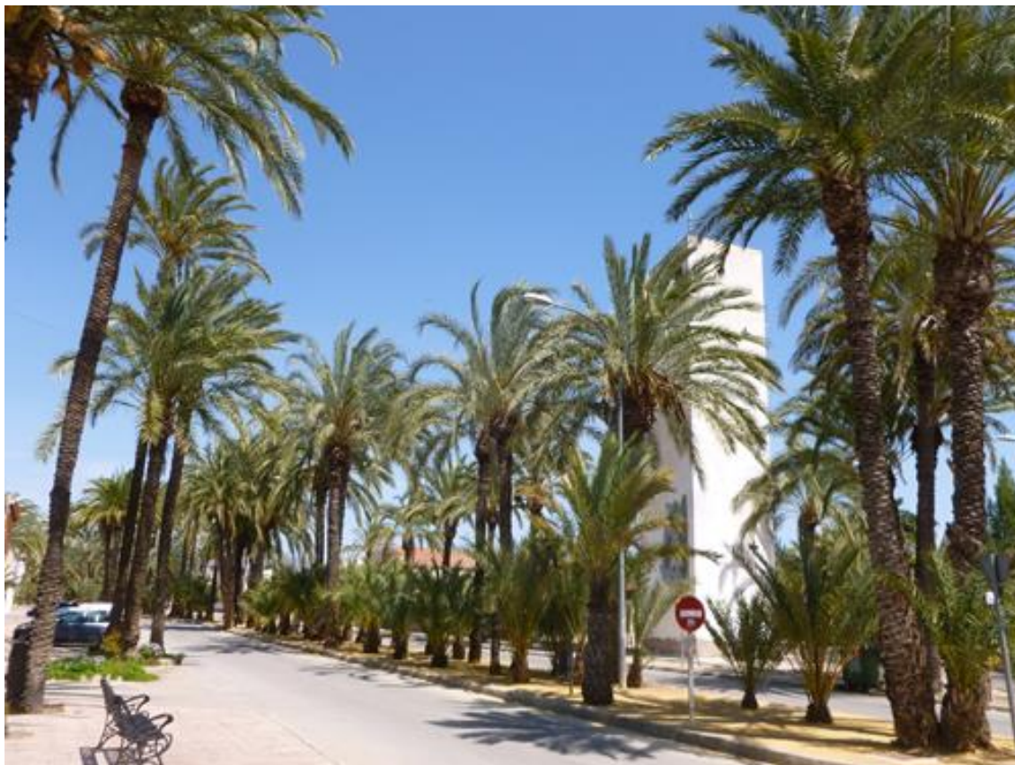
Ilustración 03. Vial principal de la población de San Isidro de Albatera, donde la palmera es dominante en el entramado urbano.

La pérdida en la calidad del dátil por el abandono en la selección de la planta para la obtención de un fruto óptimo, los mayores ingresos que suponían el comercio de la palma y la fabricación de escobas, se unieron a este desencanto. Y además, el actual desarrollo del comercio de la palmera adulta para ornamento de nuevas zonas residenciales “ha generado la última fase del expolio de palmeras datileras de Albatera y la práctica extinción de las mismas en nuestro término” . Fenómeno que se ha extendido por el resto de la superficie huertana ante la crisis de la agricultura familiar y el boom del turismo que, desde el litoral del Bajo Segura, fue penetrando hacia el interior de la comarca. Este hecho motivó el emplazamiento de nuevas urbanizaciones asociadas al auge especulativo-inmobiliario de las últimas décadas, lo que ha supuesto, en definitiva, un arranque masivo de palmeras que, diseminadas, se ubicaban linealmente siguiendo veredas, azarbes, acequias y lindes de parcelas, así como en los pequeños rodales de vegetación que circundan la vivienda agrícola, coincidiendo con el generalizado éxodo rural.