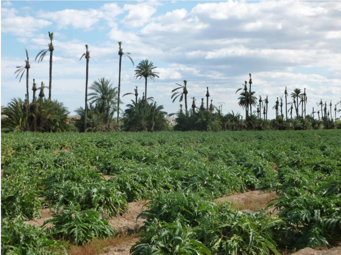
Link 03. Ringlera de palmeras siguiendo el Azarbe del Señor en Daya Nueva. Muchas de ellas aparecen desmochadas al haber sido preparadas como palma blanca para el ritual litúrgico de Domingo de Ramos.