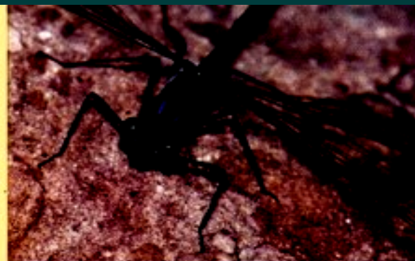
Allopedagrion sp.

tradición respecto a la creación de áreas naturales protegidas, las cuales han sido históricamente seleccionadas sobre la base de un criterio paisajístico. Estas áreas, que en total ocupan aproximadamente el 5% de la superficie del país, afortunadamente representan una amplia variedad de biomas, desde la estepa patagónica hasta las Yungas. Sin embargo, al no existir inventarios faunísticos y florísticos completos que permitan el diseño de políticas de conservación apropiadas, la presencia de una determinada especie en un área protegida no significa necesariamente la protección y conservación de la misma.