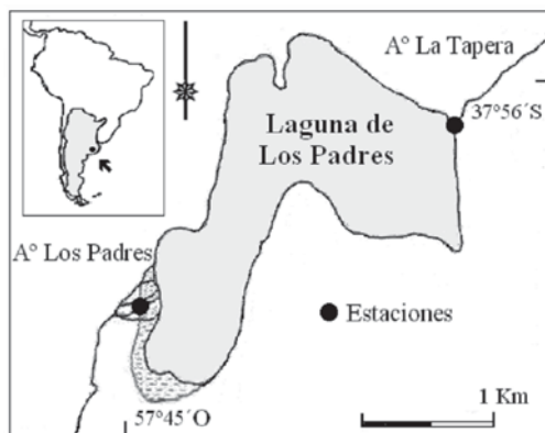
Figura 1. Arroyos vinculados a la Laguna de Los Padres: sitios de muestreo.