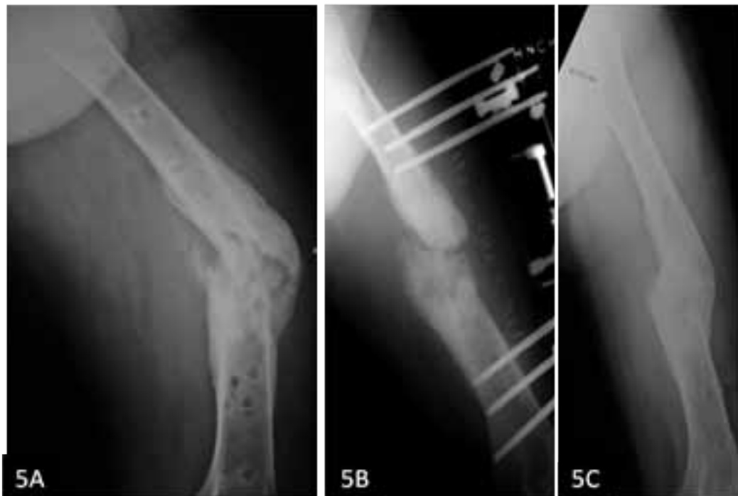
Figura 5. 5A: Radiografía anteroposterior de un varón de 26 años (Caso N°14) con no unión séptica (Cierny y Mader IV-B) a nivel de diáfisis femoral. 5B: Luego de debridamiento y erradicación del foco séptico con antibioticoterapia endovenosa y local se colocó fijador externo lateral más aporte de injerto óseo autólogo enriquecido con plasma rico en plaquetas. Nótese que tras el debridamiento existía un defecto óseo que fue rellenado con el injerto. 5C: Radiografía control a los 12 meses luego de retirar el fijador externo. Se ha incorporado en su totalidad el injerto óseo lográndose la consolidación con un eje adecuado.

(rango: 11-48) semanas. Hubo 8 casos en quienes se produjo acortamiento del segmento afectado siendo los mayores acortamientos de 3 cm (2 casos). 10 de los casos incluidos tuvieron al final rangos articulares completos, 7 casos tuvieron rangos articulares funcionales, y sólo 2 casos tuvieron pérdida de rango articular de la rodilla por encima de los 40° (Tabla 2).