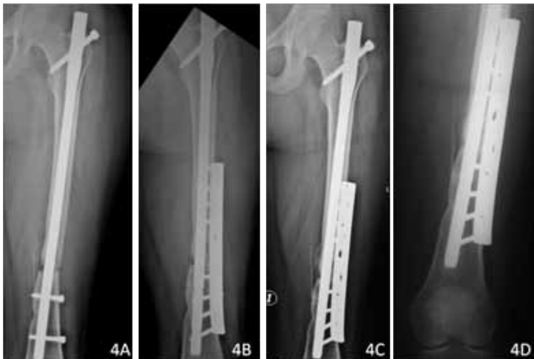
Figura 4. 4A: Radiografía anterolateral de una mujer de 20 años (Caso N°8) con no unión atrófica de fémur. Inicialmente le colocaron un clavo endomedular bloqueado sin fresado y a cielo abierto. 4B: A los 12 meses le colocaron una placa lateral a fin de mejorar la estabilidad. 4C: Por persistencia de la no unión se colocó injerto óseo enriquecido con plasma rico en plaquetas manteniendo los sistemas de fijación. 4D: Radiografía control a las 20 semanas de colocado el injerto enriquecido con plasma rico en plaquetas muestra consolidación completa.