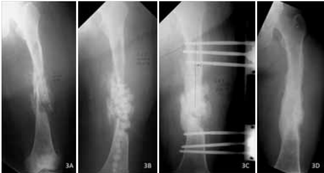
Figura 3. 3A: Radiografía de una mujer de 39 años (Caso N°15) con no unión séptica de fémur (Cierny y Mader IV-B). El cultivo fue positivo a Staphylococcus aureus . 3B: Radiografía luego de debridamiento y colocación de perlas de polimetilmetacrilato impregnadas con vancomicina. La no unión se estabilizó temporalmente con un brace ortopédico. 3C: Radiografía luego de retirar las perlas de antibiótico. Se colocó un fijador externo lateral más injerto óseo autólogo enriquecido con plasma rico en plaquetas. 3D: Radiografía de seguimiento a los 2 años muestra consolidación y remodelación.