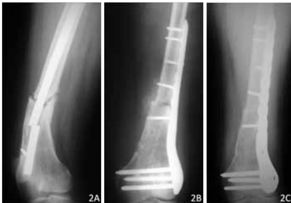
Figura 2. 2A: Radiografía anteroposterior de una mujer de 33 años (Caso N°7) con no unión diafisaria de fémur de tipo atrófica. Había sido tratada con enclavado endomedular a cielo abierto. El implante se rompió bajo carga al no existir callo reparativo. 2B: Radiografía del post operatorio inmediato que muestra reducción anatómica y fijación con placa y tornillos. En la cortical medial se observa el aporte de injerto autólogo enriquecido con plasma rico en plaquetas. 2C: Control radiográfico a las catorce semanas muestra consolidación ósea con integración total del injerto óseo.

PRP, Plasma Rico en Plaquetas; PPMMA, Perlas de Polimetilmetacrilato impregnados de Antibiótico; LCP, Placa de compresión bloqueada (Locking Compression Plate); FE, fijación Externa; IO, injerto óseo; AC, ante curvatum.