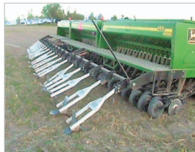
Obr. 3 – Podobně i secí stroje pro širokořádkové plodiny lze vybavit důlkovacími tělesy

Pokud mulč aplikujeme již po výsadbě, je tedy často potřeba jeho opětovné doplnění, neboť