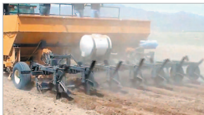
Obr. 2 – Hrázkovací těleso lze umístit přímo na sázeč a vytvořit tak asi 28 tisíc minirezervoárů na hektar, které zachytí přibližně 56 m³ srážkové vody

K cílené a přesné aplikaci mulče lze s menšími úpravami využít dostupnou mechanizaci k aplikaci statkových hnojiv, nejlépe rozmetadel s vertikálním