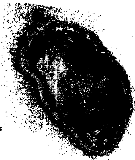
Figura 2. Áreas de distribución de la langosta espinosa Panulirus argus en el Arrecife Alacranes