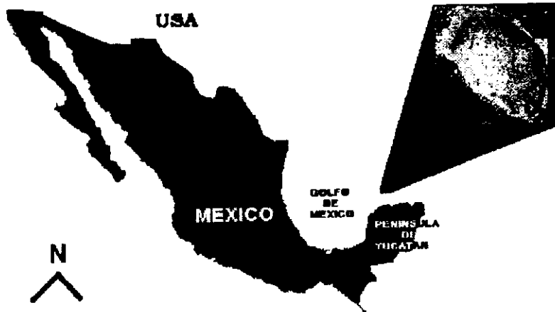
Figura 1. Ubicación geográfica del Arrecife Alacranes, Yucatán, México

estimación de la amplitud de la franja revisada.