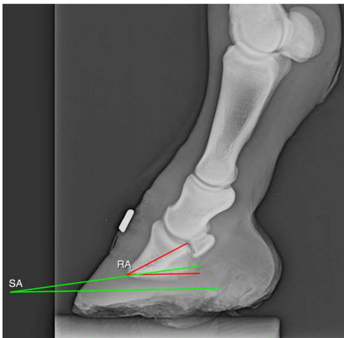
Fig. 2. Proiezione LM del piede sano dell'asino con evidenziazione dei seguenti parametri angolari: SA, RA.