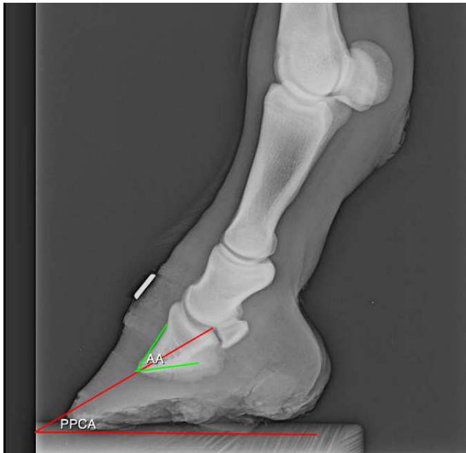
Fig. 3. Proiezione LM del piede sano dell'asino con evidenziazione dei seguenti parametri angolari: PPCA, AA.