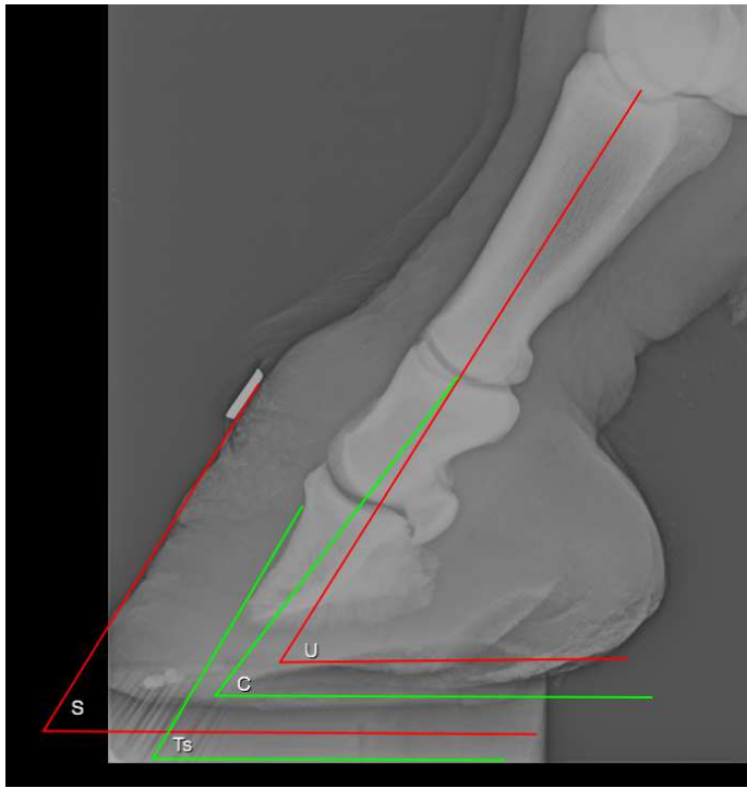
Fig. 1. Proiezione LM del piede sano dell'asino con evidenziazione dei seguenti parametri angolari: S, Ts, C, U.