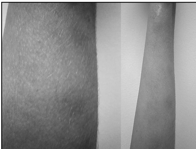
Figura 1. Lesiones nodulares induradas eritematosas en extremidades inferiores.

El paciente fue manejado y controlado por el programa de lepra a nivel local, que incluye: el manejo poliquimioterápico con clofacimina (50 mg diarios) y dapsona (100 mg diarios) durante un año, acompañado de rifampicina (600 mg) y una dosis de refuerzo de clofacimina de 300 mg una vez al mes