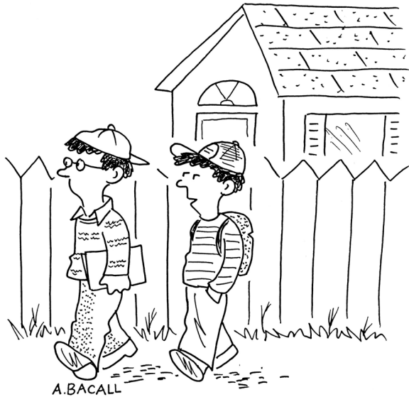
Abb. 4 Medienkompetenzen. (Quelle: www.CartoonStock.com )

“I CAN’T READ BUT I HAVE EXCELLENT TV VIEWING SKILLS.”