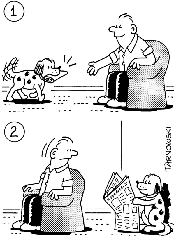
Abb. 6 Lesekompetenzen.

dies immer wieder thematisiert, in der bildenden Kunst zumal, aber auch in der Karikatur. Dort wird dieses besonders und einzig Menschliche in der Konfrontation mit Tieren präsentiert, vorzugsweise mit dem treuesten Freund des Menschen, dem Hund.