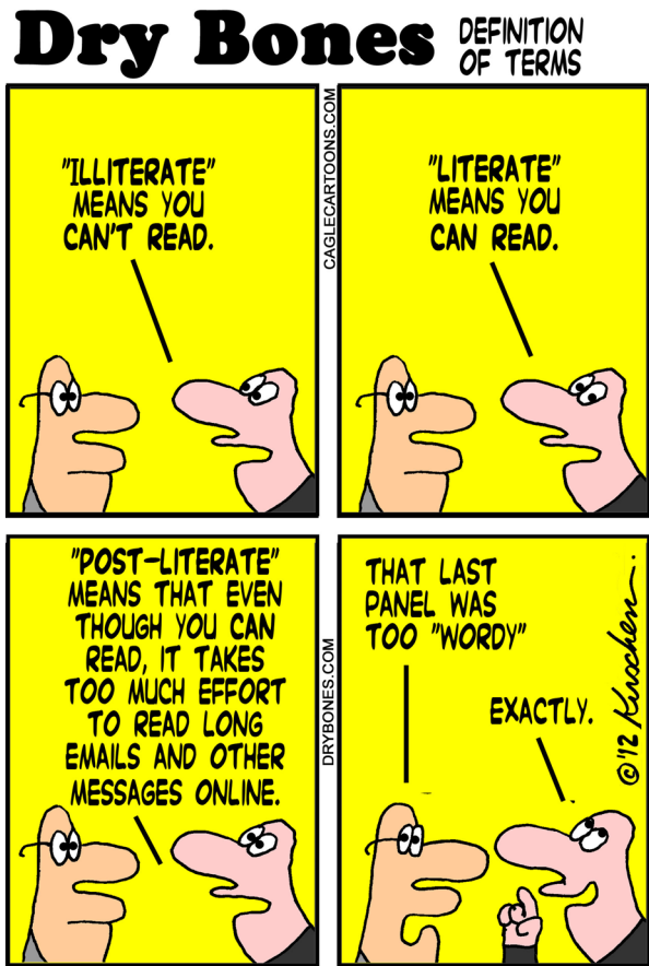
Abb. 1 Zum Begriff „Alphabet/Illiterat“. (Quelle: http://www.drybonesblog.blogspot.com )

Es ist die Verknüpfung von inhaltlicher, sprachlicher und bildlicher Dimension, die hier den „komischen“ Effekt beim Betrachter und Leser erzeugen soll. Das mit Buchstaben gefüllte dritte „Panel“ erzeugt den Spannungsknoten, der im vierten Bild („genau“) aufgelöst wird. Inhalt und Form der Aussage fallen zusammen. Die intendierte Wirkung kann nur entstehen, wenn die Wahrnehmung der drei präsentierten Ebenen mit einer vierten Ebene, der inneren Ebene der Erfahrung, zusammenfällt. Eine differenzierte Definition des Begriffs „Illiterat“ ist für die Personen, um die es geht, schon zu komplex.