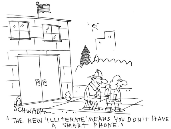
Abb. 5 „Neue“ Medien.

sen an als auch nach einem bildungspolitischen Konzept, das es ermöglichen würde, der sozialen Spaltung und einer zunehmend ungerechten Verteilung von Wohlstand entgegenzuwirken. 10 Letztlich geht es auch um die grundsätzliche Frage nach jenen Werten, denen wir heute huldigen: „Haben oder Sein?“. Das Smartphone haben ist Besitz, die Art und Weise der Kommunikation ein Element des Seins. Immanent transportiert die Karikatur damit auch Kapitalismuskritik, einen Hinweis auf die ständig akzelerierte Konsumspirale, vor allem im medialen Bereich. Die Zeichnung unterstützt hier eher den Text, nicht umgekehrt.