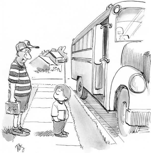
Abb. 7 Lebenslang lernen. (Quelle: www.CartoonStock.com )

"I'm going back to learn it right this time."