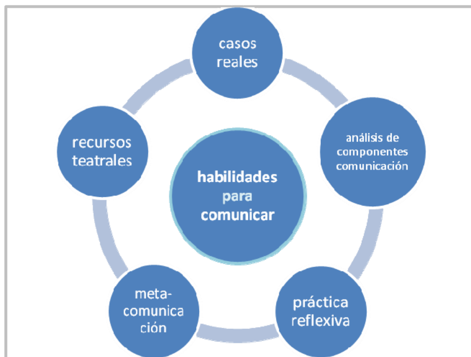
Figura 1.- Evaluar Habilidades de Comunicación: Conjunción de Estrategias y Métodos

La coevaluación, evaluación colaborativa entre alumnos y profesores, y la evaluación entre iguales o por pares (Brawn y Glasner, 2007; Dochy, 2006) son estrategias de evaluación participativa y formativa, con numerosos beneficios descritos en la bibliografía educativa e implica una concepción más democrática del proceso de evaluación.