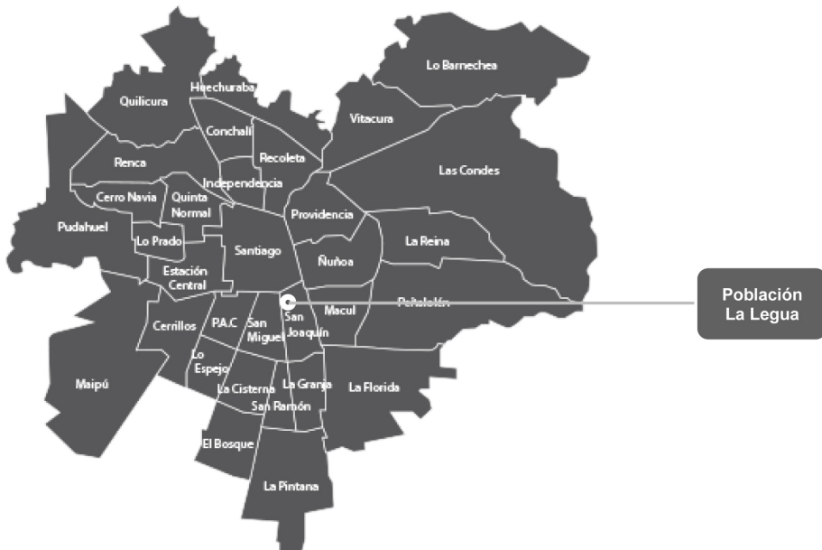
Figura 3. Localización de la Legua en el Área Metropolitana de Santiago..

La población La Legua está ubicada en la zona centro-sur del Área Metropolitana de Santiago, en la pericentral comuna de San Joaquín. La población es producto de un largo proceso de lucha y ocupación de tierras de familias sin techo y clases obreras (Larenas et al., 2018).