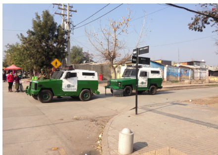
Figura 4. Imágenes del sector Legua de Emergencia y la presencia policial.