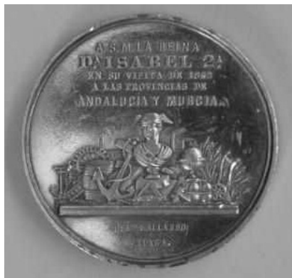
Fig. n.º 1.- Medalla conmemorativa de la visita de Isabel II a Andalucía. Todas las imágenes de este artículo han sido facilitadas por el autor del mismo.