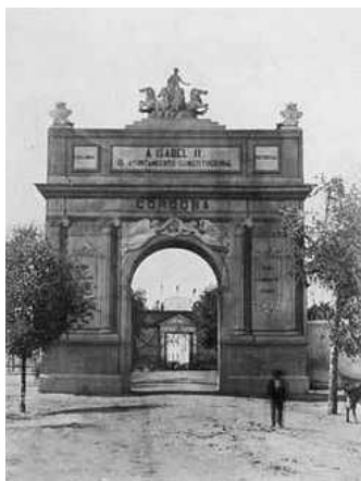
Fig. n.º 7.- Arco de triunfo de Puerta Nueva.

cia en Córdoba. En Palacio permanecieron la familia real y ciento quince servidores; el resto de la comitiva se alojó en casas particulares. Mientras, vistosas luminarias alumbraron la ciudad aquella noche del 14 de septiembre, luminarias que se mantuvieron durante toda la estancia de los soberanos en ella.