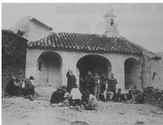
Fig. n.º 9.- Las Ermitas de Córdoba.

Isabel y Francisco de Asís se despidieron amablemente de sus anfitriones y en compañía de los ministros y del presidente