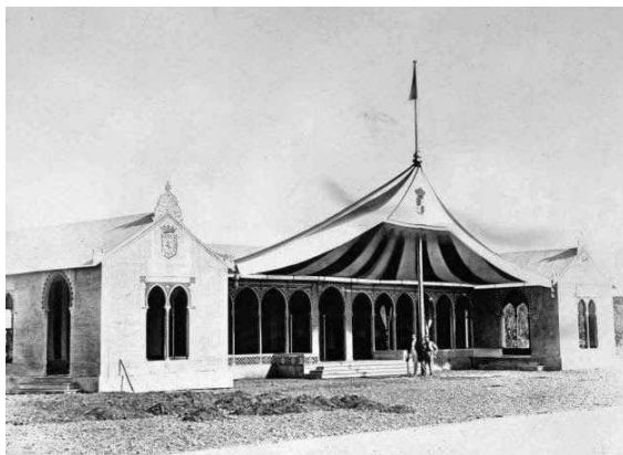
Fig. n.º 6.- Pabellón de descanso en la Choza del Cojo, a la entrada de Córdoba.

A las tres y media de la tarde empezaron a repicar las campanas de todas las iglesias al tenerse noticia de que la caravana regia descendía por la cuesta de Rabanales. Pocos minutos después los Reyes se apearon de su carruaje y entraron en la tienda después de recibir los saludos de las autoridades y del gentío allí congregado. Tras permanecer por espacio de una hora en la tienda para el aseo y cambio de ropas, los Reyes y acompañantes pasaron a ocupar los hermosos carruajes puestos a su disposición. La Reina salió de sus aposentos ataviada con un elegante