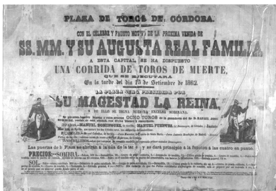
Fig. n.º 8.- Cartel de la corrida regia de 1862. Museo Municipal Taurino de Córdoba.