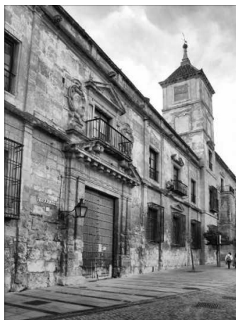
Fig. n.º 2.- Palacio episcopal. Córdoba.

Junto a los miembros de la Corte, figurarían en la comitiva regia el presidente del Consejo de Ministros, Leopoldo O'Donnell, y los ministros de Estado –Saturnino Calleja Collantes– y Fomento –Antonio Aguilar y Correa, marqués de la Vega Armijo–, que se alojarían en domicilios de aristócratas cordobeses. Con ellos también hicieron acto de presencia en la ciudad los diputados en Cortes señores León y Medina –de Villa del Río– y García Torres –de Posadas– 5 .