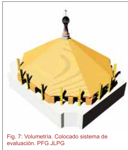
Fig. 7: Volumetría. Colocado sistema de evaluación. PFG JLPG

Para la elevación de la cubierta, en primer lugar, se procedió al refuerzo metálico de la unión entre durmientes resuelto con pletinas y barras.