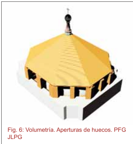
Fig. 6: Volumetría. Aperturas de huecos. PFG JLPG

cesarios para la intervención, tales como andamios perimetrales y plataformas de descarga y acopio de materiales, todos perfectamente anclados a elementos portantes.