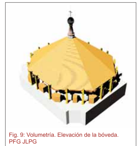
Fig. 9: Volumetría. Elevación de la bóveda. PFG JLPG

La primera etapa de la elevación fue de un centímetro, comprobando siempre que no se produjese ninguna anomalía en el conjunto y que los gatos elevaran adecuadamente, de manera equidistante, constatando, además, que su estructura leñosa no sufriese ningún tipo de deformación.