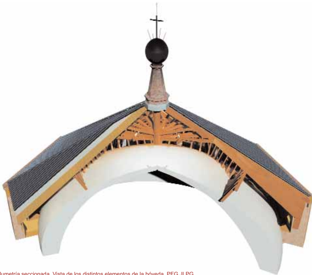
Fig. 15: Volumetría seccionada. Vista de los distintos elementos de la bóveda. PFG JLPG