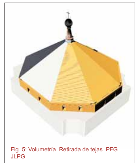
Fig. 5: Volumetría. Retirada de tejas. PFG JLPG

que parte de los aleros de dicha bóveda quedaban por debajo de la cumbrera del coro, por lo que en ese punto se producía una deficiente solución constructiva. Como consecuencia de ello, las aguas penetraban entre ambas cubiertas produciendo filtraciones y humedades que favorecen, a su vez, la pudrición de las maderas de la estructura portante y la aparición de xilófagos.