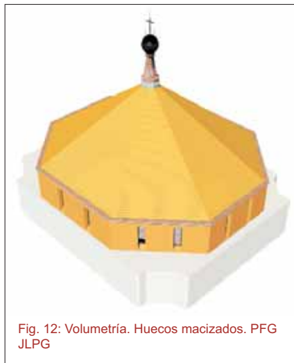
Fig. 12: Volumetría. Huecos macizados. PFG JLPG

Cargada la fábrica y liberados los gatos, se procede al macizado de huecos provisionales, manteniendo la anchura de sus ventanas que ahora cuentan con mayor altura.