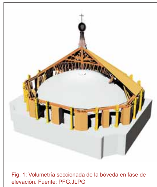
Fig. 1: Volumetría seccionada de la bóveda en fase de elevación. Fuente: PFG.JLPG

Juan Luis Prados Godoy. Universidad de Sevilla