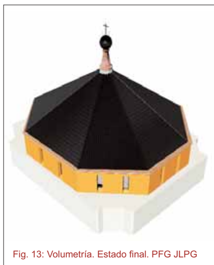
Fig. 13: Volumetría. Estado final. PFG JLPG

Se acaban los paramentos con enfoscados de mortero de cal para la ejecución de estucos y revocos