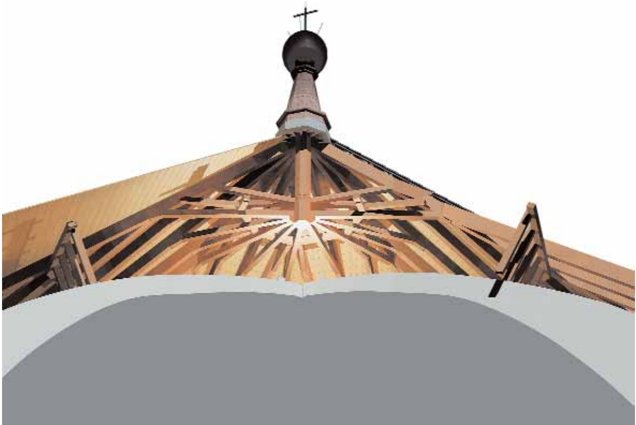
Fig. 14: Volumetría seccionada. Vista interior del traslado de la bóveda. PFG JLPG