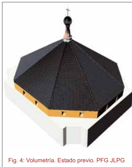
Fig. 4: Volumetría. Estado previo. PFG JLPG

En general, tanto el tejado de la bóveda central como la estructura de madera que lo soportaba, presentaban un buen estado de conservación. El problema radicaba en