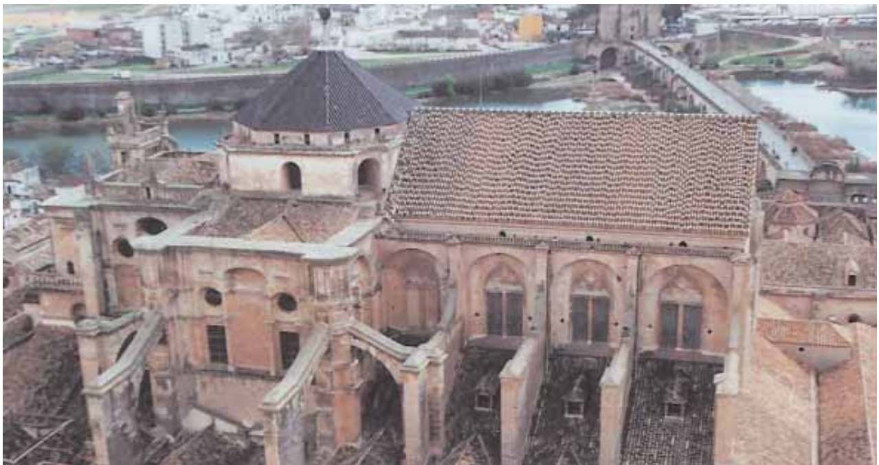
Fig. 3: Fotografía del estado previo a la intervención facilitada por los arquitectos intervinientes. Proyecto Fin de Grado Juan Luis Prado Godoy

En primer lugar, se procedió al montaje de los medios auxiliares ne-