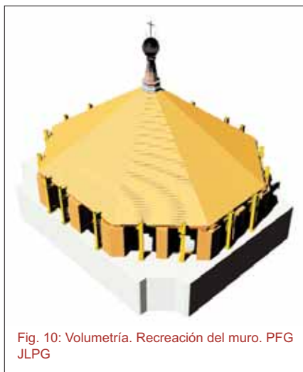
Fig. 10: Volumetría. Recreación del muro. PFG JLPG

Elevada la estructura de madera, se procede a la ejecución del muro. Éste se realiza con los mismos materiales, ladrillo macizo tosco de 24x11,5x10 cm, recibido con mortero bastardo de cemento blanco BL-II/A-L 42,5 R, cal y arena de río M-7,5/BL-L, de igual sección que el muro sobre el que apoya.