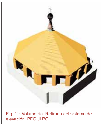
Fig. 11: Volumetría. Retirada del sistema de elevación. PFG JLPG

Más tarde, y toda vez que el proceso de fraguado de la fábrica permitiera recibir la carga, se procede al descenso de los cinco centímetros que facilitaban la colocación de la última hilada, cargando, finalmente, el muro con la cubierta de forma gradual, y garantizando una puesta en carga solidaria. Por último