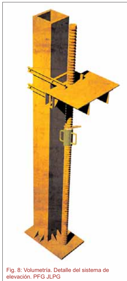
Fig. 8: Volumetría. Detalle del sistema de elevación. PFG JLPG

Tras el refuerzo, se procede al montaje de los veinte gatos hidráulicos que conformaban el sistema de elevación. Se colocaron placas de anclaje de acero S275 en perfil plano, con cuatro barras de acero corrugado, empotradas al muro. El muro perimetral posee una menor sección en las zonas próximas a los huecos, por lo cual, y aprovechando esta particularidad, se abrieron esos huecos con un mayor tamaño a fin