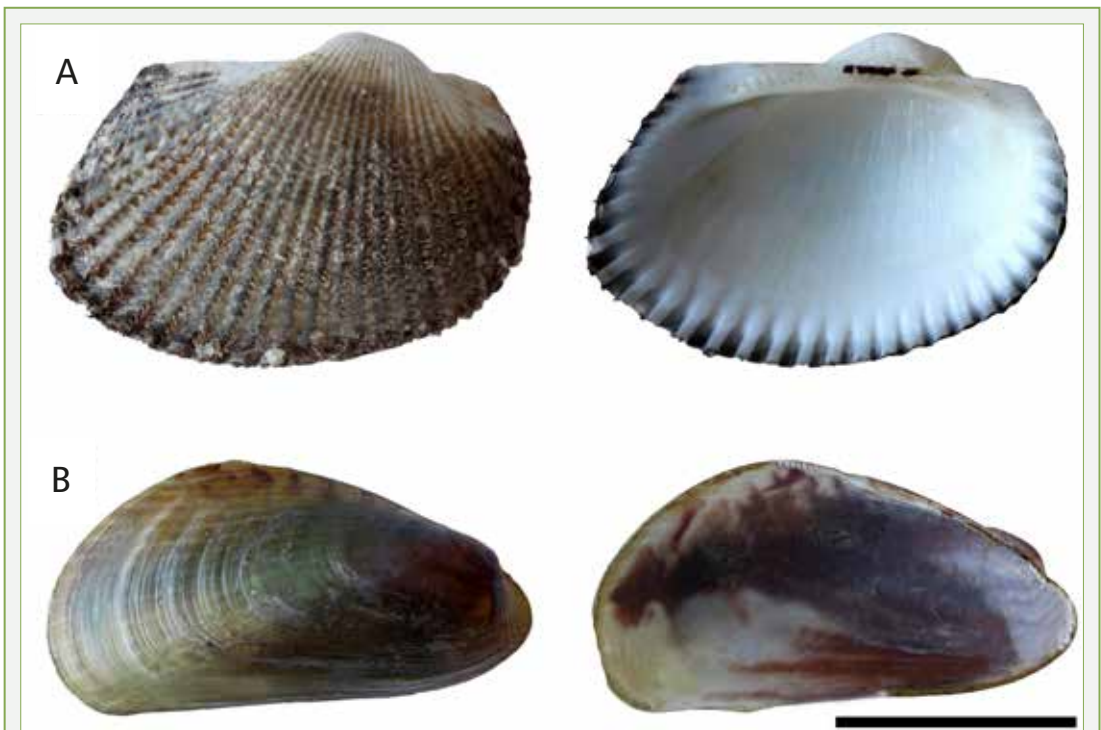
FIGURA 3. A: exemplars d' Anadara transversa (Say, 1822) i B: d' Arcuatula senhousia (Benson in Cantor, 1842) del Port de Mar (delta de l'Ebre). Vistes exteriors de la valva dreta, i interior de l'esquerra. Escala: 1 cm.

En aquest sentit, d' A. transversa es van localitzar aproximadament un miler d'individus de diferents talles, amb un màxim de 18.0 mm de longitud antero-posterior total, (molts amb periòstrac i restes de les parts toves), mentre que d' A. senhousia se'n van trobar més d'un centenar, amb dimensió màxima de 24,4 mm, molts també amb restes de l'animal a dins de la closca (Fig. 2 i 3). Per tant, a penes tres anys després de la seva primera detecció (octubre 2014), sembla que totes dues espècies han prosperat a la zona, presentant poblacions consolidades d'individus adults, i en conseqüència confirmant el seu estatus invasor a aquestes localitats, a més del seu estret lligam amb l'activitat comercial. Per tant, es proposa que aquestes dues espècies haurien de ser catalogades com a espècies invasores en els llistats territorials corresponents, independentment del seu possible efecte (negatiu, positiu o neutre) sobre les poblacions de bivalves comercials, ja que poden