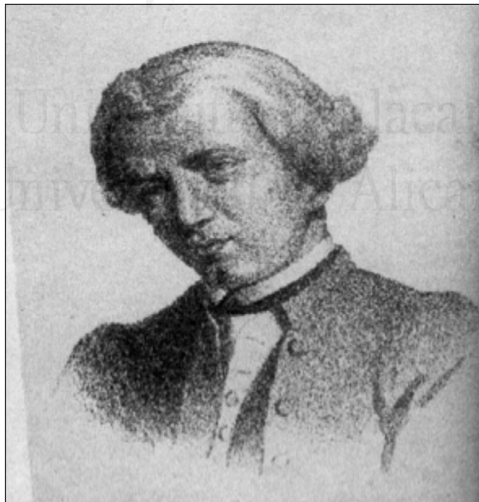
Torcuato Cayón 198

Un hecho muy significativo en lo que a la vida del edificio se refiere es la nueva imagen que tuvo tras la gran reforma de 1781. Con ella, el antiguo corral de comedias pasaría a denominarse Teatro Principal, con una presencia mucho más digna que en sus orígenes. La reforma la realizó el arquitecto Torcuato Cayón. Según las crónicas de la época el edificio estaba situado en la calle Romea sin número (actual Novena), lindando con la calle Vestuario (actualmente Barrié), y presentaba la forma de un polígono irregular debido a las numerosas fincas colindantes, que durante años se habían ido uniando al teatro. La superficie construida ascendía a 1125 metros cuadrados en total, con 89 centímetros con suelo y cielo, más veintisiete metros sin cielo, bajo la casa de Carmen Durio.