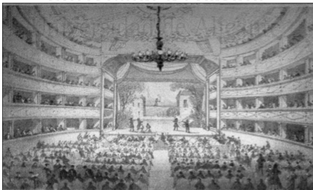
Vista del interior del Teatro Principal de Cádiz 180

La importancia del estudio del lugar donde se representaban las óperas en la ciudad se debe al hecho de la construcción de un teatro de ópera en una ciudad que vivía en líneas generales del sector primario. El marco de una ciudad marítima con flujo de pasajeros abundante, facilitaba la llegada de las novedades operísticas, que surgían en Italia o Francia y tal vez por ello se planteó la construcción de un entorno adecuado y digno, que diera prestigio a la ciudad y donde se pudieran dar funciones de ópera. Pero en realidad, esta primera apreciación hay que matizarla pues en todas las descripciones y grabados de la época destaca la importancia del patio de butacas, palcos, y pisos superiores, en detrimento del escenario, donde actuaban los cantantes que ofrecían la función, y el foso, lugar donde se situaba la orquesta que se pueden considerar como secundarios. Es decir, el verdadero interés del público se hallaba en la observación de ellos mismos y no del hecho musical en sí, al igual que ocurre en los denominados Teatros Principales de las capitales españolas.