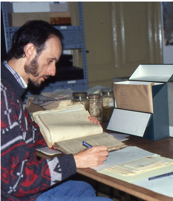
Fig. 3. En el Institut Botànic de Barcelona (1993), con la correspondencia de C. Pau.

El interés de Gonzalo Mateo por la ciencia botánica pasa también por conocer aspectos más personales de los botánicos punteros en el estudio de la flora del sistema ibérico. En particular, ha estudiado con detalle la relación epistolar del botánico segorbino Carlos Pau Español con sus contemporáneos, tanto colegas (Sennen, Font Quer, Losa) como colaboradores (los Moroder, Beltrán, Guillén), que se conserva en parte en el Institut Botànic de Barcelona (fig. 3). Fruto de ello fue la publicación de La correspondencia de Carlos Pau (1996) y diversos artículos posteriores relacionados con esta materia. Destaca el estudio de la relación epistolar de Beltrán y Pau, publicada en una serie de 7 artículos en Flora Montiberica (1997-2000). Igualmente, realizó un estudio del Herbario histórico de la Facultad de Ciencias, que constituyó la tesis de licenciatura de A. Caballer.