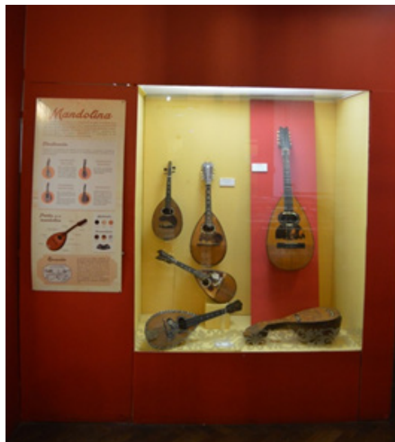
Figura 2. Sala de Cordófonos (García Santa Cruz, M. J. 2015)