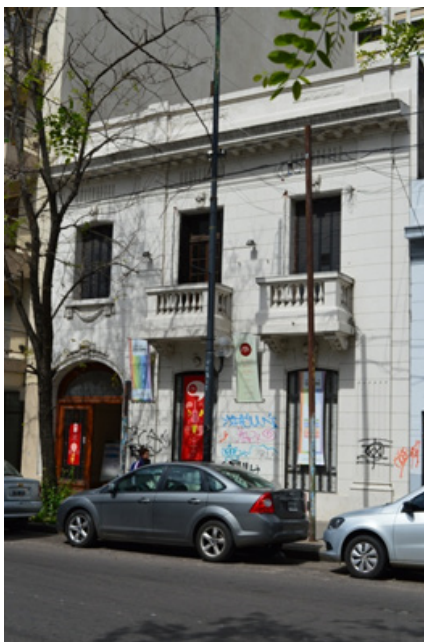
Figura 1. Vista del acceso al museo (García Santa Cruz, M. J. 2015)

La estabilidad de los parámetros ambientales dentro de los valores de conservación recomendados es esencial para la preservación de los bienes. Un monitoreo continuo de las condiciones ambientales posibilita el conocimiento preciso de la situación en la que se encuentran los objetos (Corgnati, Filippi, 2010). El monitoreo ambiental edilicio consiste en el registro y análisis de las condiciones ambientales de los distintos espacios a través de la medición continua de la temperatura y humedad relativa durante el período, por ser variables que tienen gran incidencia en la conservación de las piezas en los museos (García Santa Cruz et al., 2016).