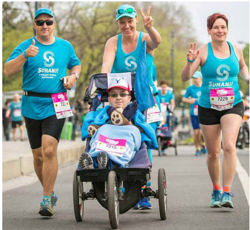
Futás futókocsival a SUHANJ! Alapítvány jóvoltából Running by jogging stroller at the SUHANJ! Foundation