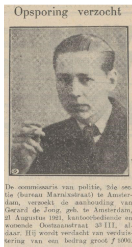
Figuur 3 Opsporingsbericht uit 1938, inclusief foto, naam en adres 38

Met de radio heeft de politie een nieuw medium tot haar beschikking. In 1925 worden politieberichten naar buitenlands voorbeeld via de ether verzonden. Ook wordt een “Commissie voor den Politie Radiodienst” opgericht. Weltens (1994/2007) beschrijft de geschiedenis van de Politie-Radio-Omroep van 1925