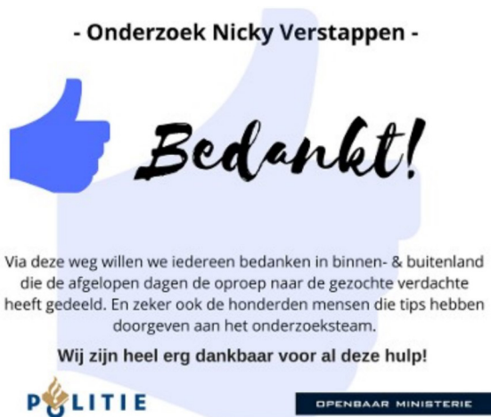
Figuur 1 Voorbeeld van bedankbericht door politie en OM, geplaatst op website en Facebook-pagina 4

Berichten om Jos B. op te sporen worden massaal online gedeeld, ook in het buitenland. 5 In de loop van de dag plaatst de politie het opsporingsbericht in verschillende talen. 6 De 'jacht op Jos B.' is in alle hevigheid losgebarsten, zo melden media, variërend van het Reformatorisch Dagblad 7 tot De Telegraaf . 8 Diverse