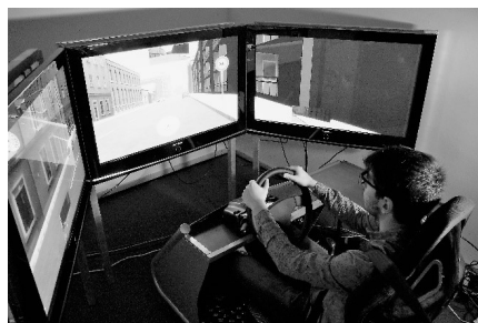
Figur 2. Kørselssimulatoren

trafik og trafik fra siden kunne identificeres (se Figur 2). Scenarierne blev designet og simuleringen i realtid blev styret med SCANer Studio (OKTAL) software.