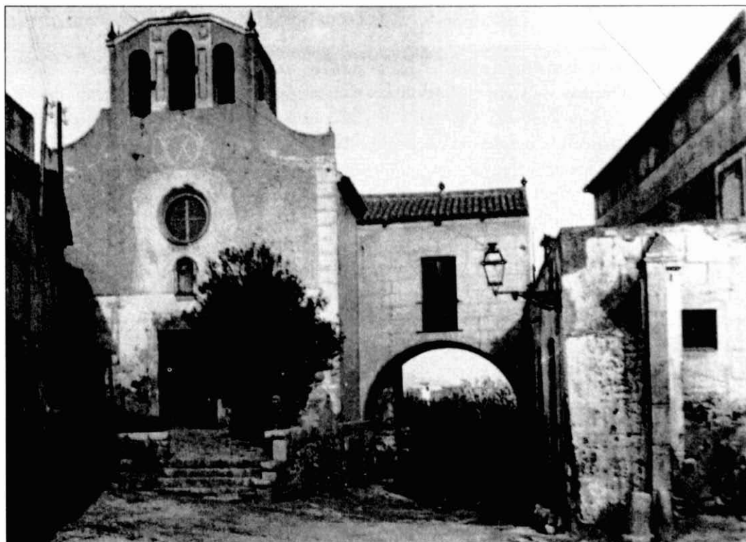
Carrer de Pere d'Artes. Capella de Santa Eulàlia i arcada de pas a Can Basté. Abans de la reforma feta l'any 1996.

Un altre lloc de reunió dins de Sta. Eulàlia era Can Porta. El seu nom original era Societat d'Obrers i Auxiliar l'Estrella. Estava formada per socis i tenia l'objectiu de ser un centre d'ajuda als seus associats en cas de malaltia. Feien ball el diumenge, teatre, i a la planta baixa hi havia un bar.