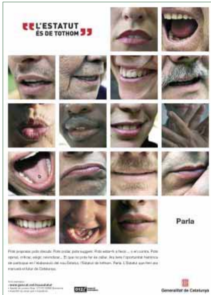
El procés participatiu va comptar amb el recolzament d'una campanya de difusió a través de diversos mitjans de comunicació