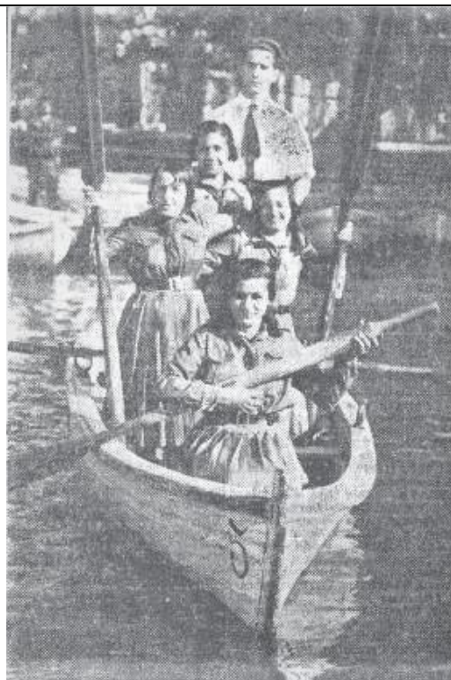
Foto 4: "Equipo de las Legionarias de la Salud que actuará en las regatas que se celebrarán en el estanque del Retiro el día 16."

24-04-1932: En una regata social sobre 500 m, el equipo A vence al B, con un tiempo de 3 min. 28 s. 1/5; 43 de haber participado en el campeonato femenino de Castilla, que en ese mismo día y lugar organizó la Sociedad Gimnástica Española (SGE), hubieran competido reñidamente con el equipo A de la SGE, que ganó el citado campeonato con un tiempo de 3 min. 25 s.