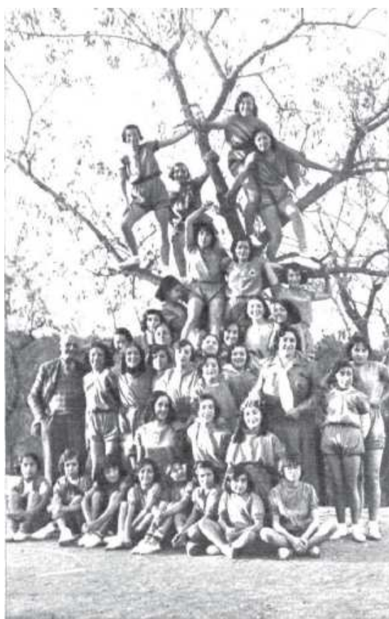
Foto 1: "Grupo de «Legionarias de la Salud» en torno de uno de los árboles de su campamento." (Foto Benítez-Casauz). Mundo Gráfico (Madrid), 15 de diciembre de 1931, 28.

Key words: WOMEN'S SPORT; WOMEN'S STUDIES; WOMEN'S HISTORY; HEALTH ACTIONS; WOMEN'S ASSOCIATIONISM; REGENERATIONISM.