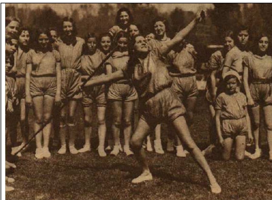
Foto 5: “Legionarias de la Salud en prácticas de lanzamiento de jabalina, en su campamento de la Casa de Campo.”. Ahora (Madrid), 16 de abril de 1932, 16.

En sus “excursiones” dominicales, las Legionarias practicaban con asiduidad pruebas de atletismo, desde las más sencillas, como carreras de velocidad (50, 60, 100 metros lisos) o saltos de altura y de longitud, hasta otras más complejas como lanzamientos de disco o de jabalina. (Foto 5.)