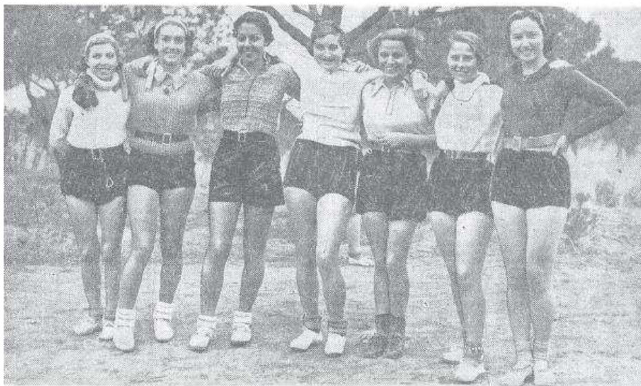
Foto 2: “Las señoritas clasificadas de las diversas pruebas deportivas celebradas por las Legionarias de la Salud durante su campeonato social celebrado en los pinares de Hortaleza.”. La Voz (Madrid), 28 de febrero de 1935, 11.

Entre los individuales, las Legionarias practicaban asiduamente atletismo y, seguramente con mucha menos frecuencia, esquí y tiro con arco.