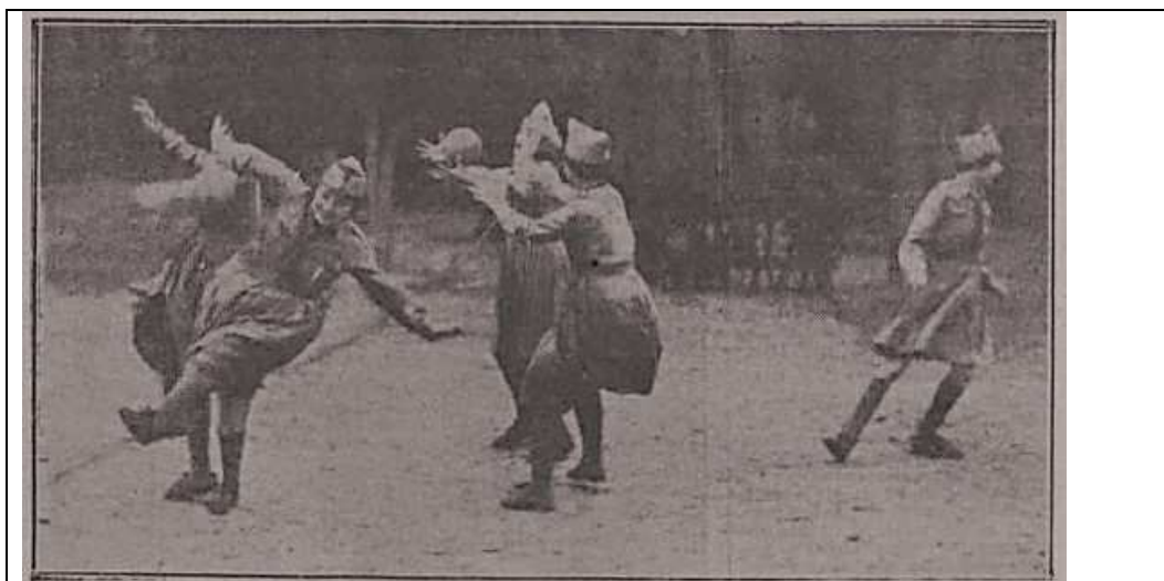
Foto 3: "Baloncesto Femenino.—El bello e higiénico deporte del baloncesto se ha popularizado entre nuestras muchachas. Las "legionarias", institución cuyas educativas finalidades fueron en su día recogidas en estas columnas, lo incluye en su programa deportivo. He aquí un momento del partido jugado por las "legionarias" en los Viveros, en el que puede apreciarse que no les falta fogosidad."

8-05-1932 Equipo A (infantil), 26 – Equipo B (infantil), 6. 24