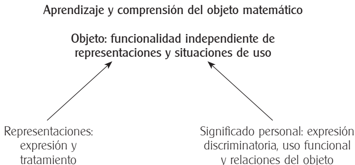
Figura 2. Los aspectos de representación y significado de un objeto matemático son los medios para alcanzar su comprensión

La figura 2 expresa que el aprendizaje de un objeto matemático abarca el aspecto representacional del objeto y el desarrollo de un significado personal sobre él. Ambos aspectos son medios que permiten alcanzar la comprensión del objeto.