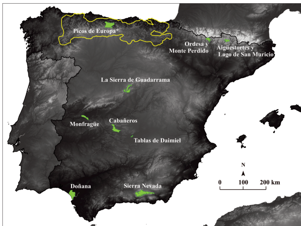
Figura 1. Situación de la Cordillera Cantábrica (enmarcada en polígono amarillo) y de los Parques Nacionales continentales de la península ibérica (polígonos verdes) utilizados en la revisión bibliográfica del presente estudio.

Figure 1. Location of the Cantabrian Cordillera (framed in yellow polygon) and of the Continental National Parks in the Iberian Peninsula (green polygons) used in the bibliographic revision of this study.