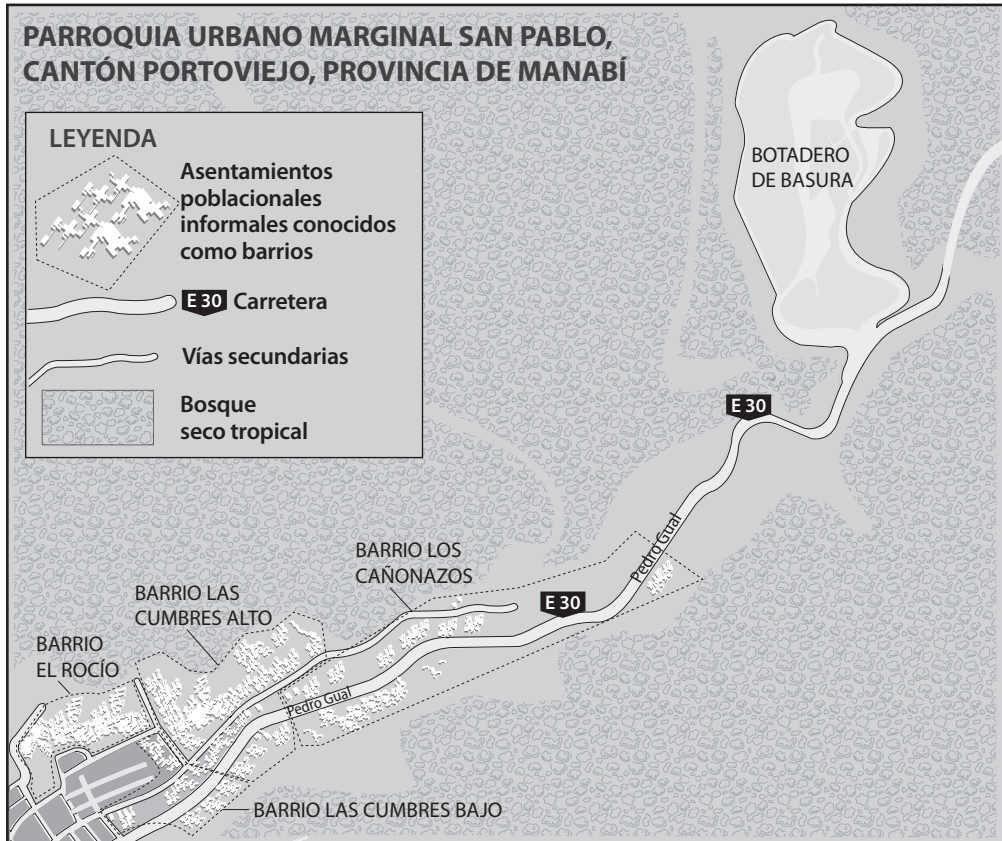
Mapa 3. Afecciones en el barrio Los Cañonazos