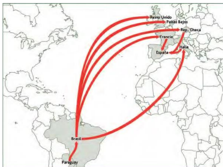
Imagen 3. Itinerarios América: Brasil-Paraguay.

Para completar el perfil de dichas mujeres, se analizan el nivel educativo y el conocimiento del idioma que poseen según las distintas nacionalidades ya mencionadas.