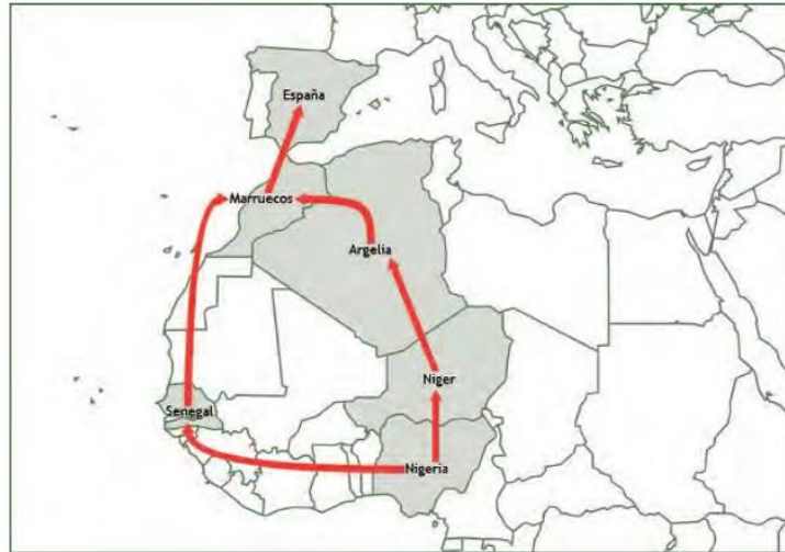
Imagen 2. Itinerario África.

importante en el proceso que suele tener lugar en el hogar de la propia víctima. Se obliga a las víctimas, que son trasladadas a Europa (Italia, los Países Bajos, Bélgica, España, entre otros), a pagar cantidades exorbitantes a los traficantes que las transportan. La gran mayoría de las mujeres y niñas de África occidental son sometidas a la prostitución callejera (ver Imagen 2).