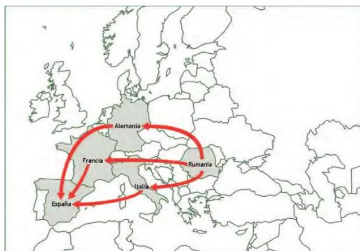
Imagen 1. Itinerario Europa-Rumanía.

Según el Defensor del Pueblo (2012), existen tres rutas que comunican distintos países a los que son trasladadas estas mujeres, la primera de ellas nace en Rumanía y comunica este país con gran parte de Europa (ver Imagen 1). Rumanía es el primer país de origen de las víctimas de trata con fines de explotación sexual. Tanto el perfil de persona en situación de riesgo como el de la persona víctima de trata con fines de explotación sexual coincide: mujer de nacionalidad rumana de entre 18 y 32 años de edad. Se ha encontrado en España 234 víctimas de trata provenientes de Rumanía en el año 2010.