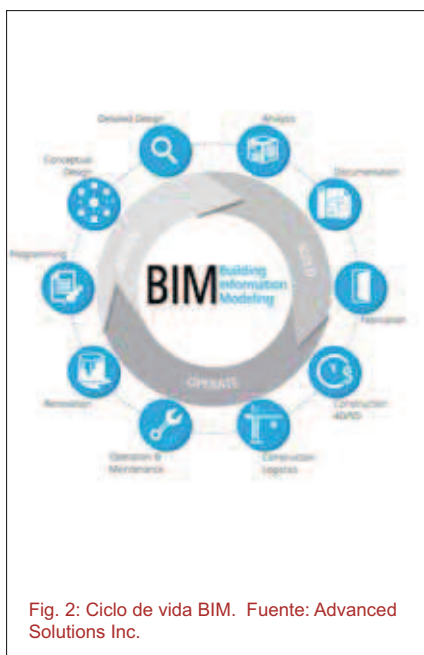
Fig. 2: Ciclo de vida BIM.

La amplia difusión y divulgación que está adquiriendo la metodología, involucrando a todos los sectores intervinientes en el ciclo de vida del edificio (Fig. 2) como benefactores del cambio, nos hace reflexionar sobre sus promesas y el reporte real/tangible de las mismas.