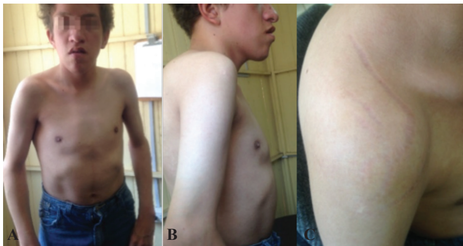
Figura 4. Conformación del tórax: A) Hábito marfanoide, tórax corto en quilla. B) Extremidades gráciles con limitación funcional. C) Piel delgada, clara con estrías gruesas.