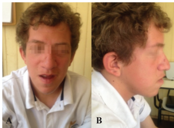
Figura 3. Características faciales: A) Facie alargada, asimetría, eritema malar, prognatismo. B) Hipopigmentación de piel, eritema malar, hipoplasia medio facial.

luxación bilateral de cristalino y glaucoma bilateral. A los 14 años presentó episodio brusco de hemiparesia izquierda, concomitantemente aparecieron episodios de agitación psicomotora y alucinaciones visuales, así como conductas compulsivas.