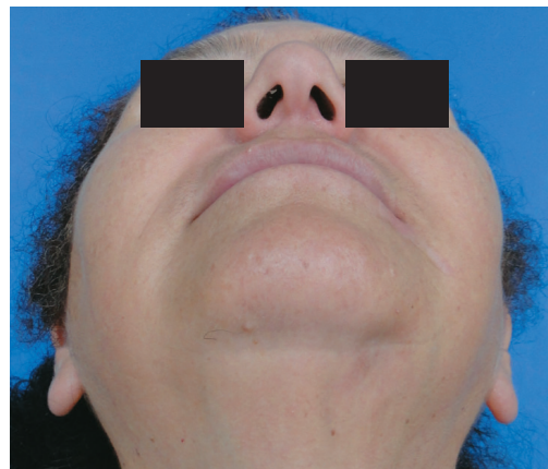
Fig 6. Control postoperatorio.