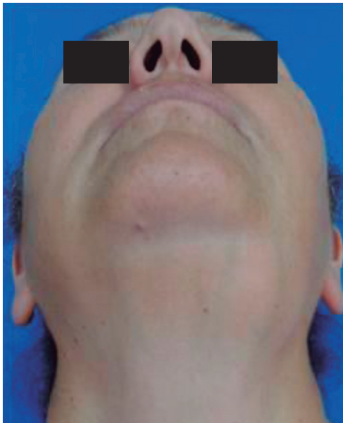
Fig 1. Aumento de volumen submandibular izquierdo.