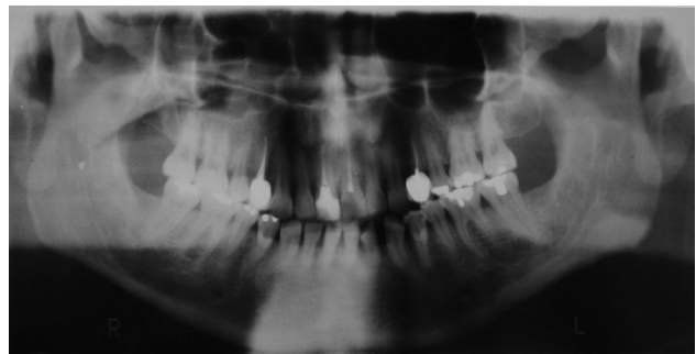
Fig 5. Ortopantomografía de control post quirúrgica.