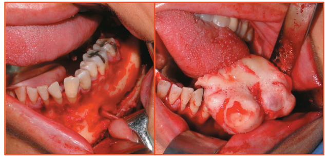
Fig 3. Osteotomía de lesión.

Se envía espécimen quirúrgico a estudio histopatológico para su descalcificación, que lleva un tiempo prolongado. En la descripción histológica se reporta hueso lamelar vital maduro sin médula ósea y poca actividad osteoclastica. (Fig. 4). Se toma radiografía de control a la semana de postoperatorio, donde se observa adecuado contorno y simetría mandibular. (Fig 5 y 6).