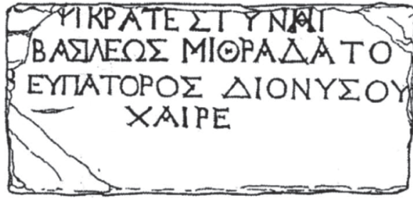
Abbildung 3: Umzeichnung von Abbildung 2