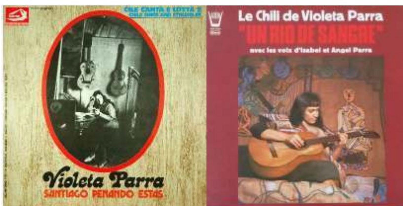
Portadas de los discos "gemelos" derivados de Canciones reencontradas en París : a la izquierda, la edición italiana del disco Santiago penando estás y a la derecha, la edición francesa de Un rio de sangre, que Arion publicó también en Italia, con comentarios traducidos al italiano.