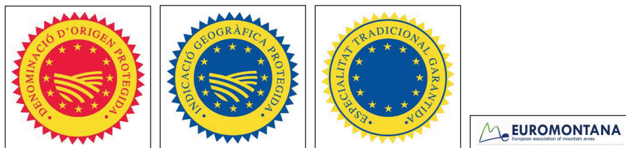
FIGURA 1. Els logos de les tres principals marques geogràfiques europees i el de l'única menció de qualitat facultativa que s'ha concedit fins al moment