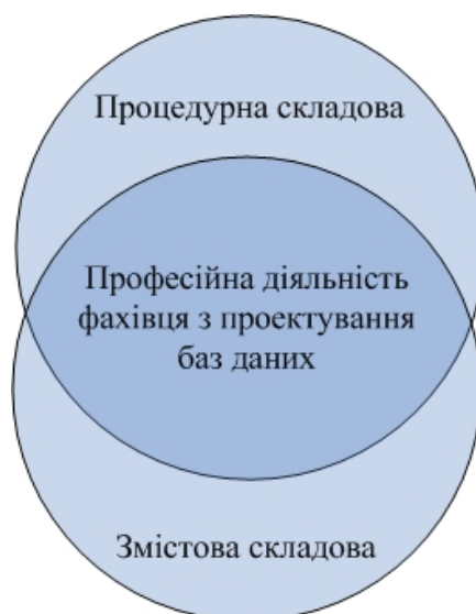
Рис. 1. Складові професійної діяльності фахівців з проектування баз даних

Державний стандарт вищої освіти підготовки інженерів-педагогів регламентує знання та уміння з проектування баз даних, які забезпечує дисципліна «Принципи побудови і захист інформації баз даних». Програма дисципліни розкриває змістову компоненту професійної підготовки фахівців з проектування баз даних [5, с.26].