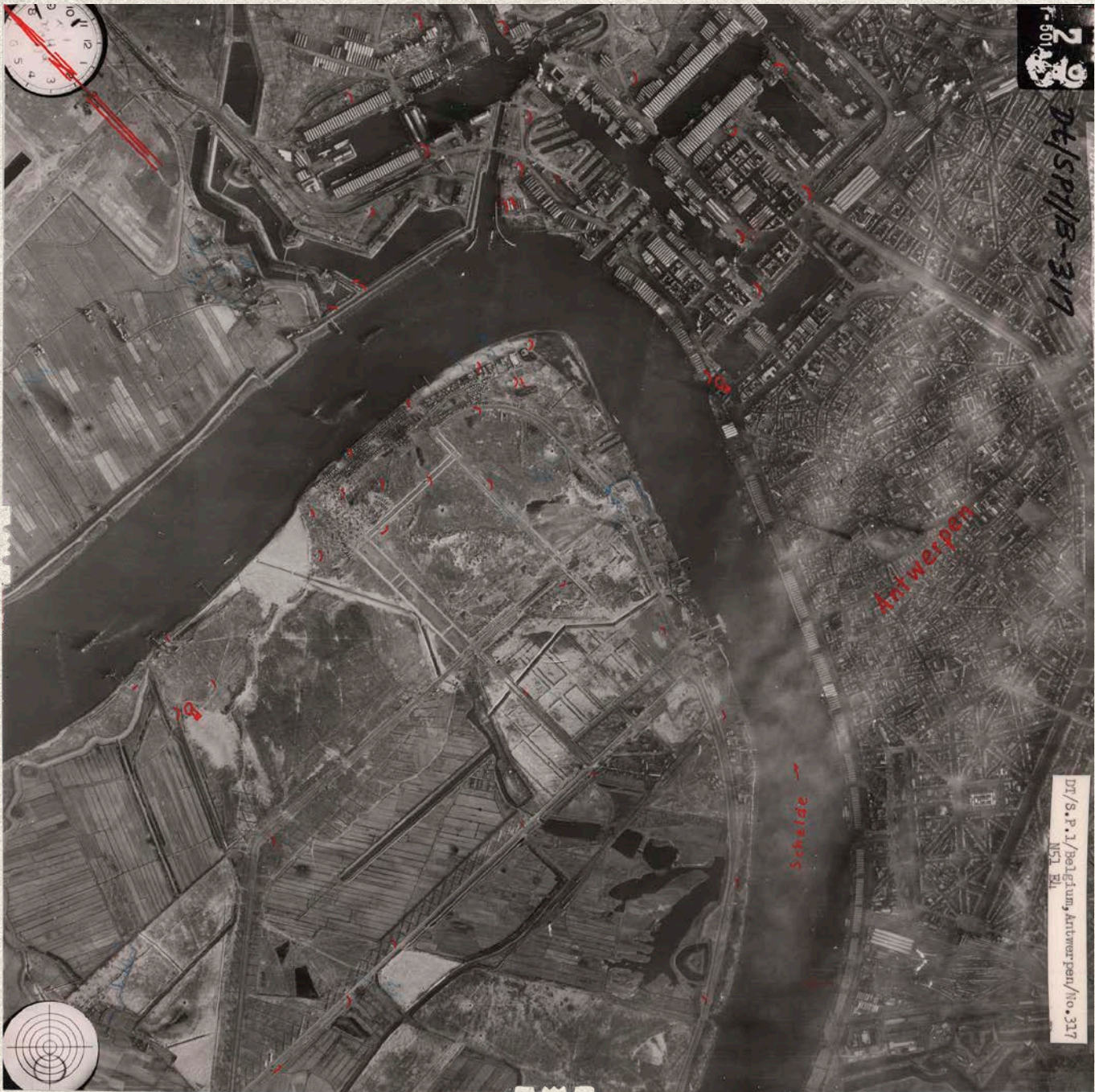
Een foto van 25 december 1944 toont het centrum van Antwerpen en het begin van de havenstructuur met resten van het Noordkasteel aan de Scheldeoever. Op Linkeroever zijn aanwijzingen van militaire activiteit te zien, onder meer een oefenterrein en een tankgracht. Onderaan zien we op de rechteroever het begin van de Grote Omwalling van Brialmont, en over de Schelde de resten van het fort van Burcht.