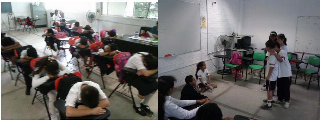
Figura 1. Los niños inquietos después de ser sensibilizados, lograron relajarse para participar en actividades de reflexión y empatía; y posteriormente en pequeños grupos, se logró la integración social amistosa en juegos dirigidos.

Una vez que los niños fueron sensibilizados para trabajar sus problemas, se inició la Intervención , primero grupal y en la medida que iban saliendo los problemas, se trabajó en forma individual con cada uno ellos. En la etapa de sensibilización, algunos habían mostrado algún tipo de problema o conducta no aceptada socialmente, por lo que se les entrevistó aparte del grupo, para conocer qué era lo que le sucedía; también se trabajó con aquellos niños donde el docente a cargo del grupo, identificó algunas características del trastorno del Déficit de atención (TDA). Entre las estrategias de intervención se realizaron relajaciones con música, cuentos Sufi, análisis y reflexión de vivencias, dinámicas de auto-concepto, autoimagen, empatía, valores, autorrealización, autoestima y fortalecimiento de la resiliencia.