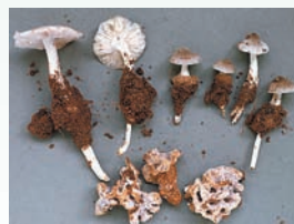
Termitomyces amb el niu del tèrmits, Ouagadougou, Burkina Faso.