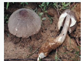
Termitomyces fuliginosus , Ouagadougou, Burkina Faso.