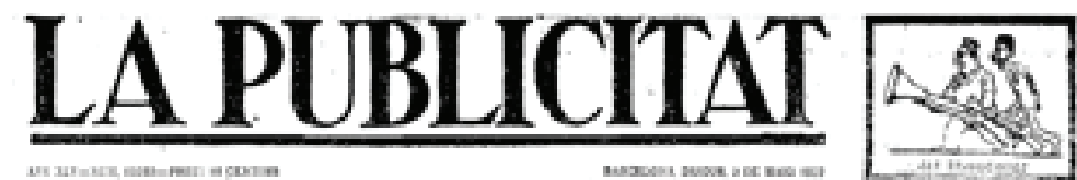
La vinyeta situada al costat de la capçalera, on estigué entre 1923 i 1927.

Per tant, observant avui la col·lecció del diari es fa difícil, per no dir impossible, concloure si Apa havia de fer una caricatura diària i la censura li ho impedia, o si tenia estipulada la publicació de vinyetes uns dies concrets a la setmana —ritme impossible d'escatir, ja que la publicació o no de dibuixos no sembla