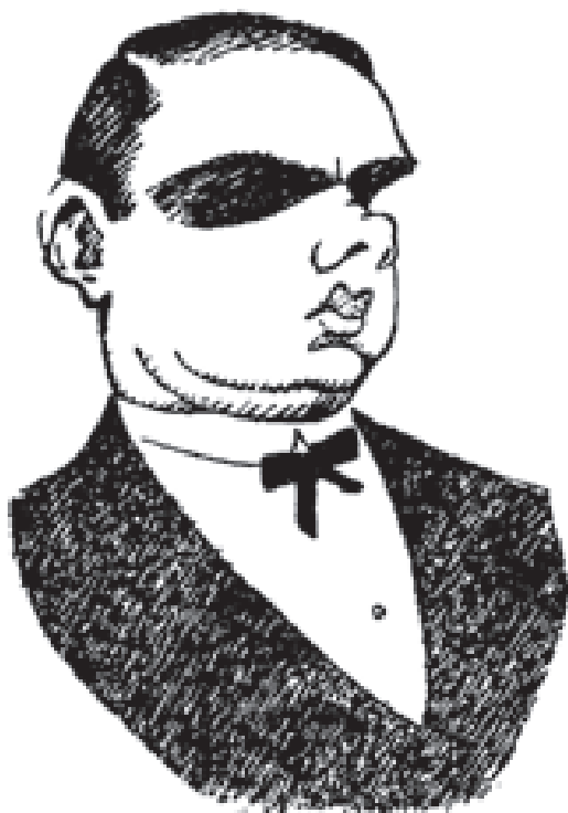
Autocaricatura de Feliu Elias publicada en el calendari de 1911 del Papitu .

emplaça per altres mecanismes de percepció i comprensió. Un altre factor essencial de la caricatura, ultra el seu format visual, és el seu to humorístic. L'humor ofereix un ampli ventall de recursos, de la sàtira més mordaç a la lleugera ironia, passant per la comicitat poètica o el contrasentit més o menys gracios. Sigui com sigui, el registre humorístic permet la distorsió, la transgressió, car retrata la realitat en un mirall deformant i fantasiós, no sotmès a les normes que ha de complir qualsevol altre material periodístic. En aquestes imatges humorístiques o satíriques, el dibuix suma les connotacions estètiques a les semiòtiques. Al contrari de la il·lustració, sempre lligada a un text, els dibuixos de les vinyetes satíriques es poden comprendre de forma independent a la resta del contingut informatiu de la pàgina en la qual van ubicats, si bé moltes vegades les vinyetes es refereixen als temes de l'actualitat més recent. La intenció d'aquestes vinyetes és aportar una reflexió despreocupada, una visió crítica o satírica, de vegades tendra i altres vegades ferotge de la realitat.