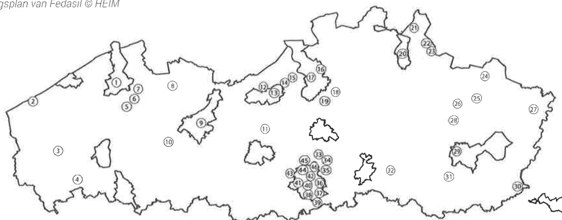
II. 03-A: Spreiding Vlaamse opvangcentra Fedasil en partners