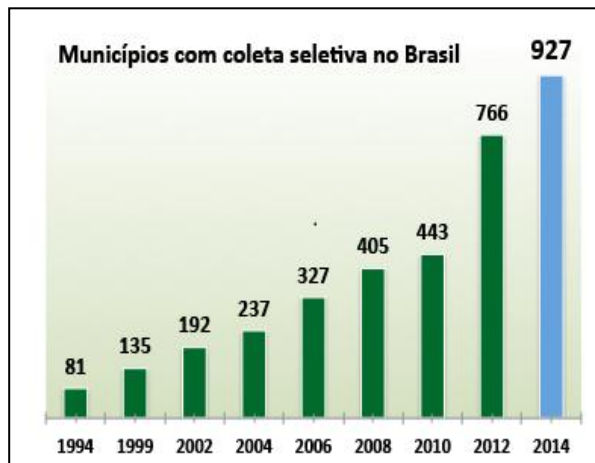
Gráfico 1 – Municípios com coleta seletiva no Brasil

Para Gouveia (2012), os catadores são considerados um elo importantíssimo da indústria de reciclagem, pois esses grupos vêm realizando um trabalho de grande importância ambiental, atuando de maneira informal ou organizados em formas de cooperativas ou associações, colaborando significativamente para o retorno de diversos tipos de materiais para o ciclo produtivo, gerando economia de energia e de matéria-prima, evitando assim que esses materiais sejam destinados a aterros.