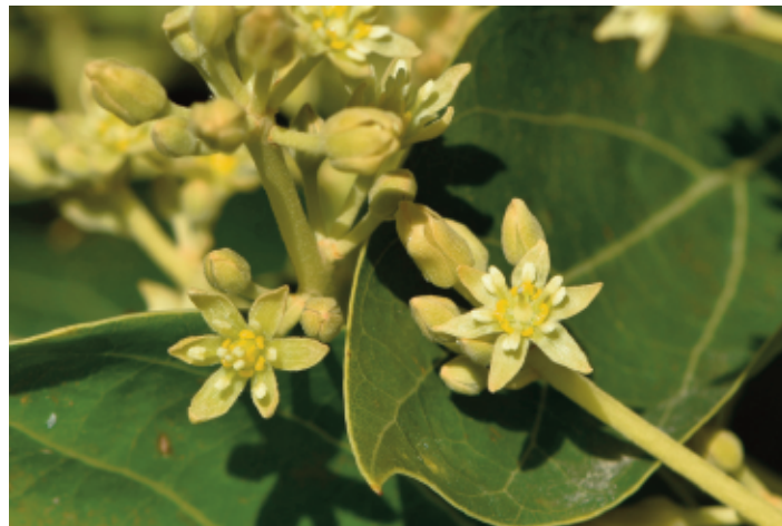
Figura 1. Flores de aguacate, diferencias entre la flor en estado femenino (izqda.) y masculino (dcha.). La flor en estado femenino se está cerrando mientras que la flor en estado masculino se está abriendo. Dependiendo de las condiciones ambientales este solape en estados sexuales dentro de la misma panícula y árbol puede durar entre 2 y 4 horas favoreciendo la transferencia de polen por insectos desde flores en estado masculino a flores en estado femenino.

A nivel mundial, la abeja de la miel, introducida en América por los españoles en el siglo XVI (Crane 1992; Roubik 1998), es un importante polinizador para el aguacate, aunque debido al poco atractivo de sus flores, la polinización suele ser poco eficiente y estas abejas frecuentemente se desplazan a flores de otras especies que les son más atractivas. Cuando se compara la composición de néctar de las flores de aguacate con la de cítricos (que resulta altamente atractivo para las abejas), se observa un mayor contenido en potasio y fósforo, elementos que resultan repelentes para las