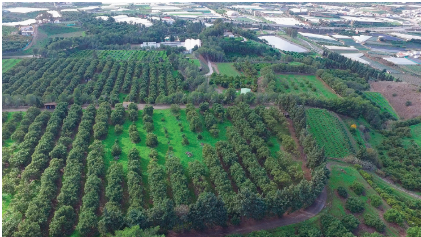
Figura 5. Foto aérea de la estación experimental La Mayora del Instituto de Hortofruticultura Subtropical y Mediterránea la Mayora (CSIC) en Algarrobo-Costa, Málaga, donde se aprecian distintas parcelas con colecciones de mango, aguacate y chirimoyo.

Figure 5. Aerial photo of La Mayora experimental station that belongs to the Spanish National Research Council (CSIC) in Algarrobo-Costa, Malaga, Spain; different experimental plots and parcels holding germoplasm collections and cultivars of mango, avocado and cherimoya.