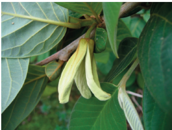
Figura 3. Flores de chirimoyo.