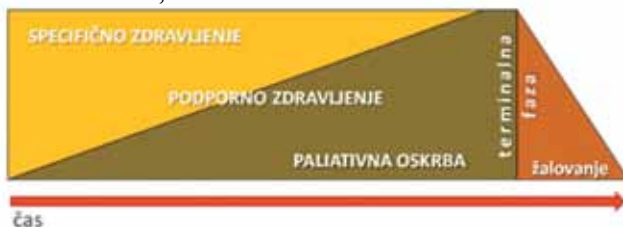
Slika 1. Sestavni členi dobre celostne oskrbe bolnika z neozdravljivo boleznijo skozi čas

umiranjem bolnika ter med njihovim žalovanjem (Slika 1). V zgodnjem obdobju zdravljenja neozdravljive bolezni se paliativna oskrba prepleta s specifičnim in podpornim onkološkim zdravljenjem, v zadnjem obdobju bolezni pa praviloma prevladuje v celotni oskrbi bolnikovih potreb. Rak debelega črevesa in danke (RDČD) spada po incidenci med najpogostejše rake v Sloveniji. Po podatkih Registra raka RS letno umre nad 700 bolnikov z RDČD (2). Večina teh bolnikov potrebuje paliativno oskrbo. V primerjavi z drugimi državami EU v Sloveniji nimamo vzpostavljene mreže paliativne pomoči bolnikom na primarnem nivoju. Bolniki se zato pogosteje obračajo na bolnišnično